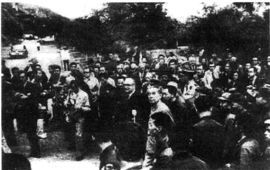
1973年9月15日,周恩来陪同法国总统蓬皮杜参观云冈石窟