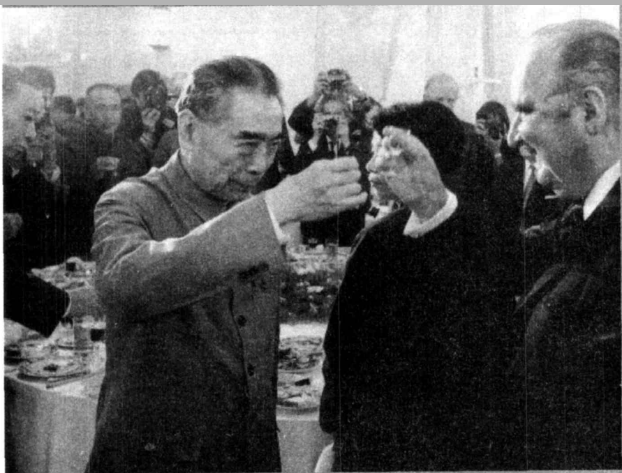
1973年9月11日，周恩来在欢迎宴会上与法国总统蓬皮杜干杯

25年后，在一篇采访蓬皮杜遗孀克洛德·蓬皮杜夫人的报道中，道出了其中的原由。蓬皮杜夫人和丈夫是从保尔·克洛岱尔的诗集《认识东方》中认识中国的，并由此产生了对中国的向往之情。而中国大同的云冈石窟在他心目中是极具世界性、颇显民族特色的艺术珍宝。溯源历史，尽人皆知：北魏建都于平城（今大同），并在武周山