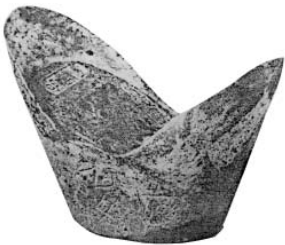
图一 清光绪银元宝

作为银辅币除上述5种外,另有光绪八年吉林机器局铸有1钱、3钱、半两、7钱等4种,四川铸有8分至3钱2分3种,皆不过一时之造。清末三次颁布银辅币有5钱、3钱、1钱3种;5角重3钱6分,2角重1钱4厘4分,1角重7分2厘3种;5角重库平3钱6分,2角5分重1钱8分,1角重8分6厘4毫3种。至于主币有龙