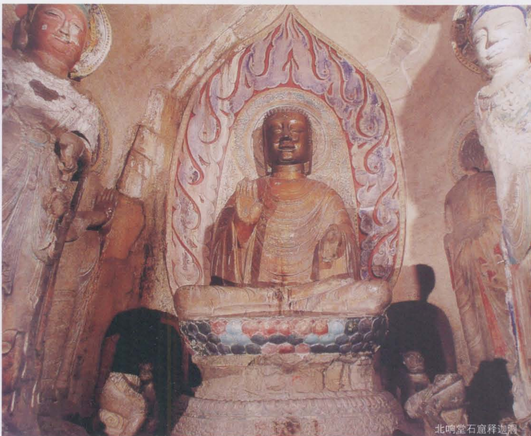
北响堂石窟释迦洞