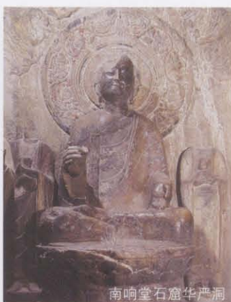
南响堂石窟华严洞