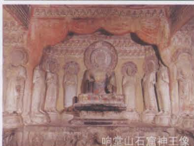
响堂山石窟神王像