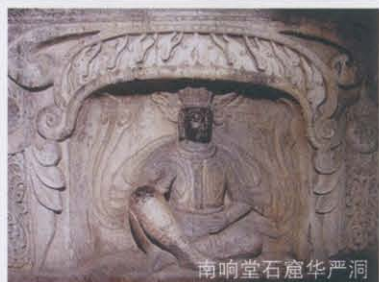
南响堂石窟华严洞