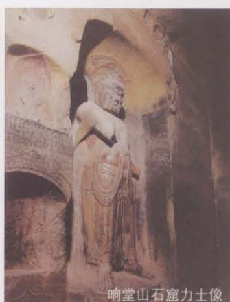
响堂山石窟力士像