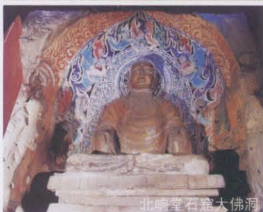
北响堂石窟大佛洞