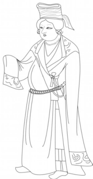
图3 第159窟吐蕃赞普线描图

莫高窟第231窟听法图队列6人,吐蕃赞普仍为第四身位置。赞普头戴棕红色朝霞冠,系同色红抹额,左后侧发绳上系橘色绒球发饰。颈戴红色珠饰。身着左衽翻领白色素袍,翻领为蓝绿色,形如158窟赞普之翻领,长袖及地,右手袖口内露出和翻领同色的衬里。腰系红色革带,革带上圆形蓝色饰物,可能为绿松石或青金石等宝石镶嵌物,革带上也配短刀和蹠蹠七事。袍内着内色短襦,领口处可见黑色交领,下着深蓝色重裙,蓝绿色镶边,里面露出一截白色的裤子,足上也是黑色软靴。该赞普没有披云肩,长袖也没有虎皮或织锦袖缘。(图4)