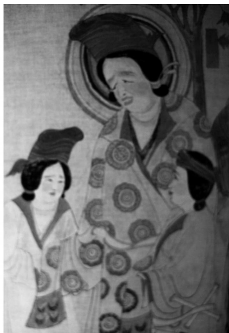
图 1 莫高窟第 158 窟吐蕃赞普及其侍从(局部)