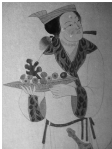
图4 莫高窟第231窟吐蕃赞普及其前一身侍从(局部)李其琼临摹