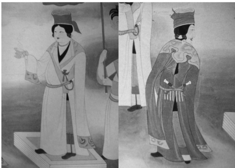
图2 莫高窟第159窟吐蕃赞普及其前一身侍从(局部)李其琼临摹