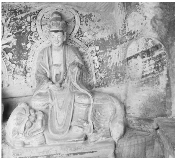
图三 4号龕文殊菩萨

形背光，通高1.1米，肩宽0.3米。右为夫子，长胡须，头挽发结，彩绘圆形背光，双手握法器，于左肩上扬，结跏趺坐于莲台，身穿朝服，腰间系带打结，通高1.1米，肩宽0.3米。