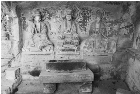
图二 观音、文殊、普贤三尊

5号龕，方形，高1.2米，宽1.9米，系儒、释、道三教合龕造像。中为释迦牟尼佛，身穿“v”形袈裟，结跏趺坐于莲台，饰披肩，胸饰缨络，低肉髻，彩绘圆形背光，双手捧法物于胸前，通高1.1米，肩宽0.3米。左为老君结跏趺坐于莲台，双手握胸，捧法器于右肩，身穿“v”形道服，胸前系带打结，长胡须，头挽发结，彩绘圆