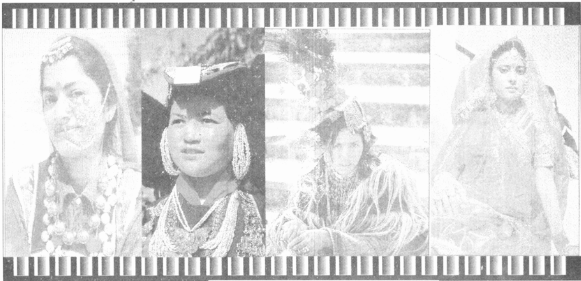
印度不同地区的新娘装