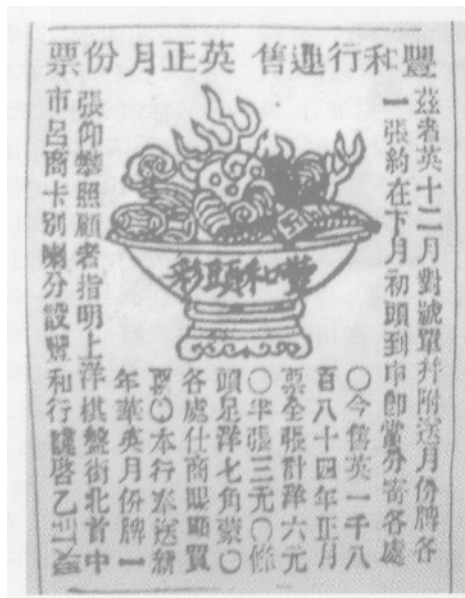
图二// 丰和行月份牌广告

购取照印字画新式机器一付,因特创点石斋精室,延请名师监印。凡字之波折,画之皴染,皆与原本不爽毫厘。兹先取古今名家法书楹联琴条等,用照相法照于石上,然后以墨水印入各笺,视之与濡毫染翰者无二。……兹者无论年代之久远,但将原本一照于石,千百本咄嗟立辨,而浓淡深浅着手成春。此固中华开辟以来之第一巧法也” [5] 。在此之前的《申报》馆采用的是器械铅字印刷技术,只是印刷书籍和报纸,尚未印书画艺术作品。如在1876年之前的《申报》和1876年3月1日“华英月份牌”广