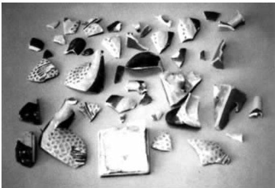
修复前的成化素三彩鸭熏