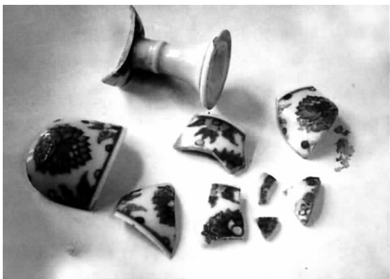
修复前的成化莲荷花团纹高足杯

成化莲荷花团纹高足杯，高7.8厘米，上径6厘米，底足内侧有“大明成化年制”青花横款。出土时碎成9块，缺失5块。该瓷外绘团花折枝莲，被艺人于莲花荷叶间巧妙点出几片黄芽，清丽悦目，生气盎然。成化斗彩以其纹饰幽雅、色彩艳丽闻名于世。它代表景德镇明代彩瓷的最高水平，为历代鉴赏家、收藏家所珍爱。根据记载，明末清初“成杯一对，价值十万”，足见其价值不菲。而今，一件不足10厘