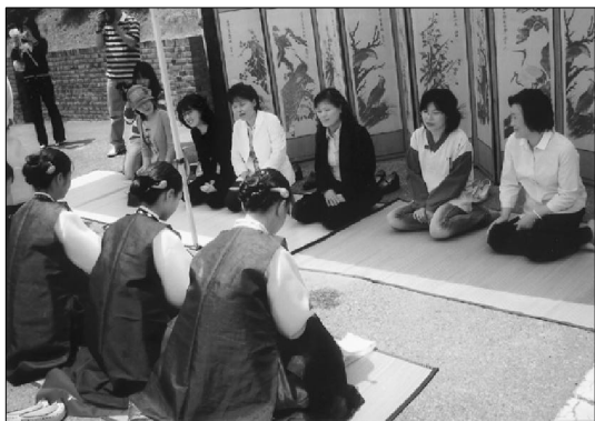
成人礼仪式——笄礼后见尊长