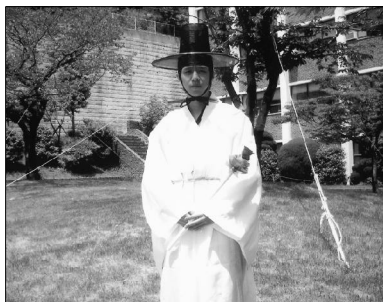
参加成人礼仪式后的男生