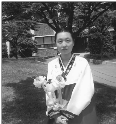
参加成人礼仪式后的女生