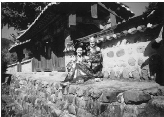
韩国新娘与洋新郎在乡校举行婚礼

新娘漂亮,也很大方。在其与新郎于大成殿院外由照相馆的摄影师拍照时,笔者也示意拍照,并用英语言明我是中国人,新娘竟然会说少许汉语,于是笔者便用汉语向她贺喜,她也很高兴。