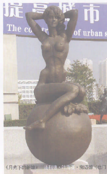
《月光下的新娘》 法利德·叶海亚·撒迈德(也门)