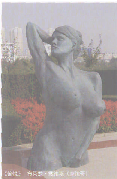
《愉悦》 布莱兹·戴维斯 (津纳哥)