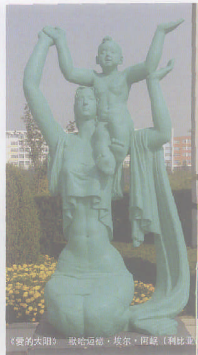
《爱的太阳》 歌哈迈德·埃尔·阿岷（利比亚）