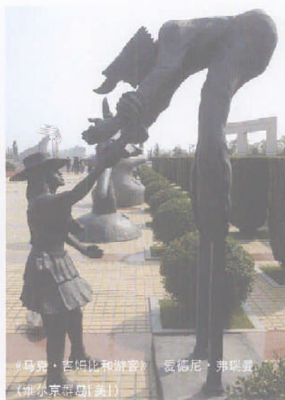
《马基·吉姆比和游客》 爱德尼·弗瑞曼 (维尔京群岛[美])