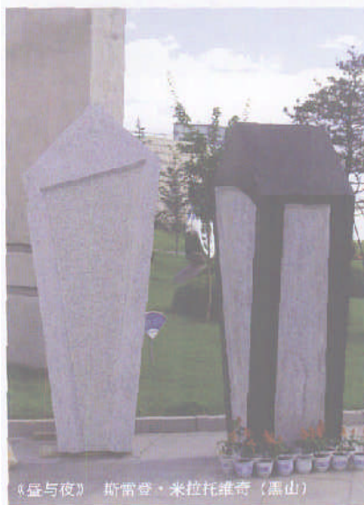
《昼与夜》 斯雷登·米拉托维奇 (黑山)