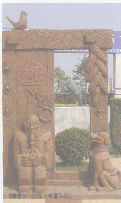
《暖春》 张琨(中国陕西)