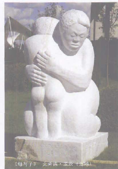
《母与子》 充芳德·孟发(内地)