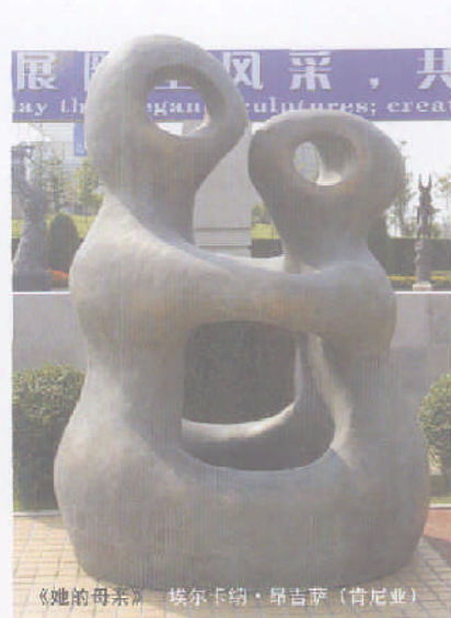
《她的母亲》 埃尔卡纳·昂吉萨(肯尼亚)