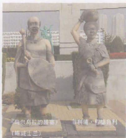
《马尔乌拉的盛宴》 菲利普·穆德鲁利（斯威士兰）