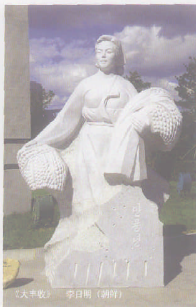
《大丰收》 李日明（朝鲜）