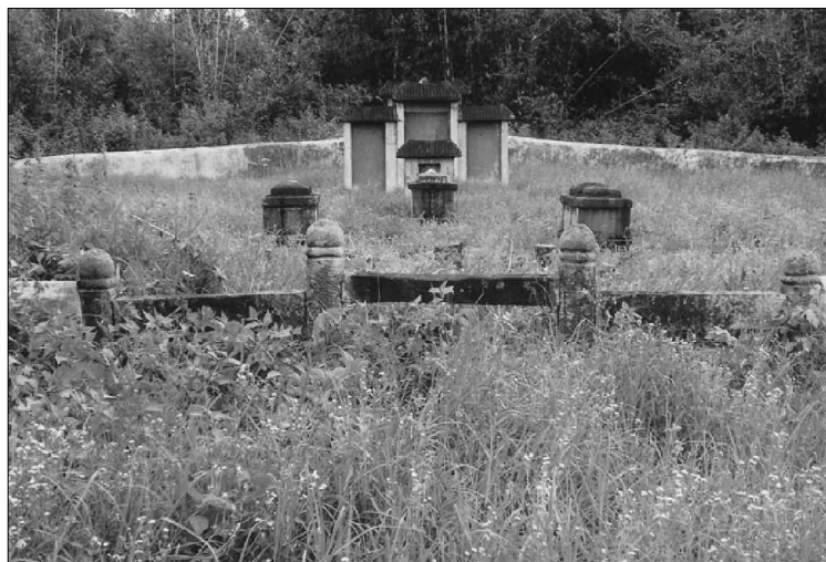
湛江市白鸽山谢安母亲庄太君夫人墓（中），两边是其曾孙谢琨夫妇墓。