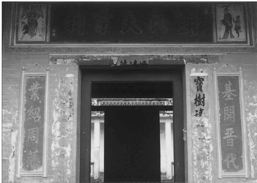
附城镇榜山村大宗祠

但是，盛筵难再，好景不常。谢琨只在雷州半岛当了一年多的学官，便因朝廷政局发生变化，弄得有家难归。原来东晋末年，权臣刘裕飞扬跋扈，玩弄天子于股掌之上，他派人缢杀了口不能言、不辨寒暑的傻子皇帝安帝，又立其同母弟司马德文为恭帝。元熙二年（420年）六月，刘裕