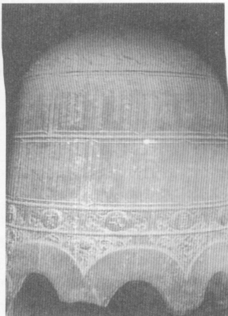
图六 襄汾县汾城镇 西圪塔村帝舜庙元代铁钟