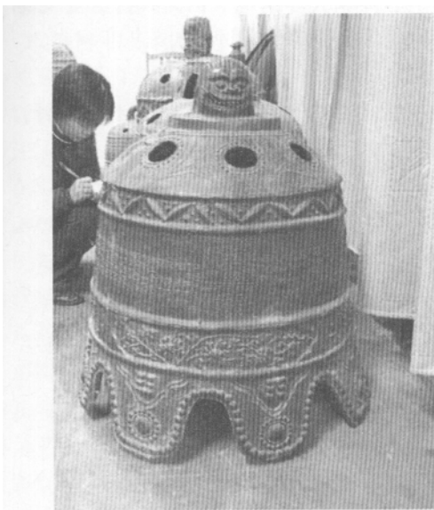
图一〇 汾西县康熙二十二年铁钟

第二,造型和装饰独特,具有地域风格,是北方地区古钟的重要组成部分。钟体通高在数十厘米至 200 多厘米之间,钟钮为双龙交叠的蒲牢造型。钟体顶部为覆钵形,常分布有 6 或 7 个圆形孔洞,多光素