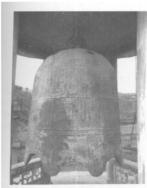
图一 夏县石碛村北宋铁钟