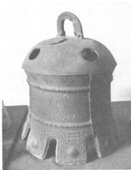
图一一 石楼县同治二年铁钟