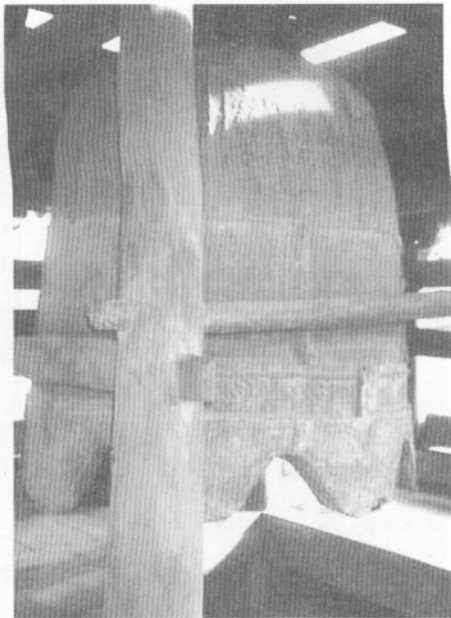
图七 襄汾县古城镇 京安村释迦寺钟楼明代铁钟