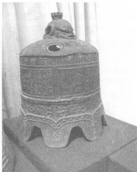
图九 平阳县襄陵县 观音庙康熙二十九年铁钟

1120年改为河津县,1994年,撤消河津县,设立河津市。襄陵,汉初建县,因有晋襄公陵墓而得名。1954年襄陵县、汾城县合并而成襄汾县。邢让在《明史》卷一百六十三列传第五十一中有载,邢让,字逊之。襄陵人。年十八,举于乡,入国子监。为李时勉所器,与刘珝齐名。“景泰元年,上疏主张迎回英宗,后参与修撰《英宗实录》及《辟雍通志》。”为人负才狭中。