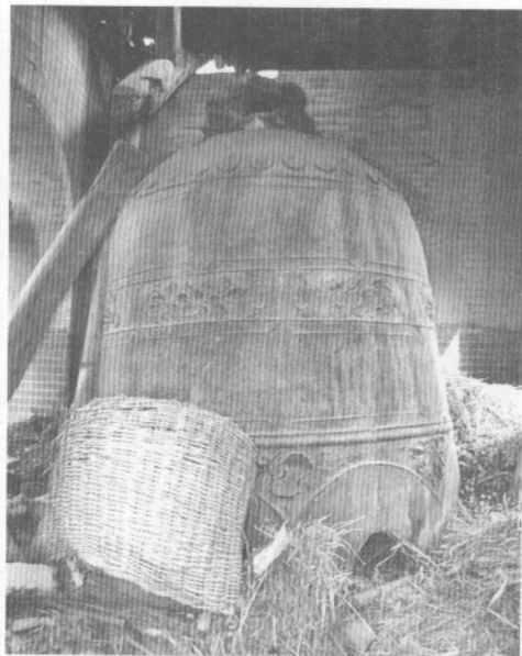
图四 夏县周村龙泉禅院金代铁钟

晰,足见当时冶铸之精。据当地父老相传,抗日战争时期,日本文化特务曾试图以40元大洋购得,但在村人千方百计保护之下,终未得逞。其能保存至今,至为可贵。