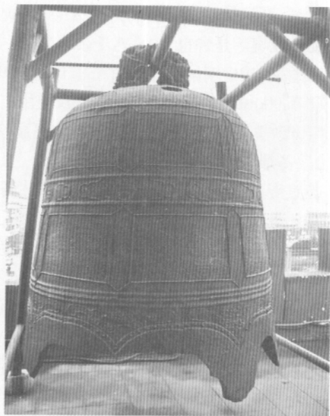
图三 临汾大中楼金明昌七年铁钟