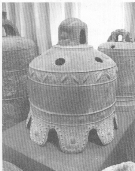
图八 平阳县康熙四十六年