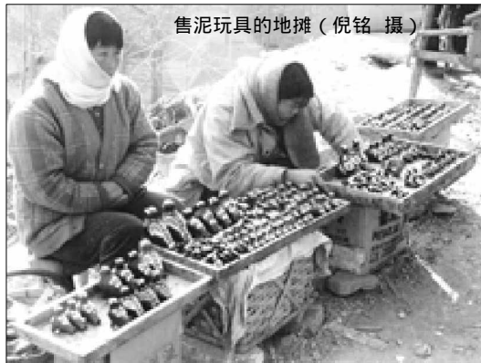
售泥玩具的地摊