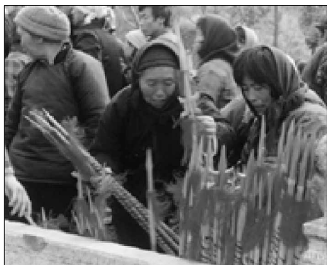
给儿孙选购红缨枪的奶奶

庙会期间的摊铺上还可以看到一些木玩具，如木制的红缨枪、剑、戟等。红缨枪枪头涂以银白色，系以红色的麻丝，杆为红黄相间的螺旋花纹，备受儿童喜爱。此外，还有柳编的篮子、簸箕等，条光色净，制作精良，在庙会期间也十分畅销。