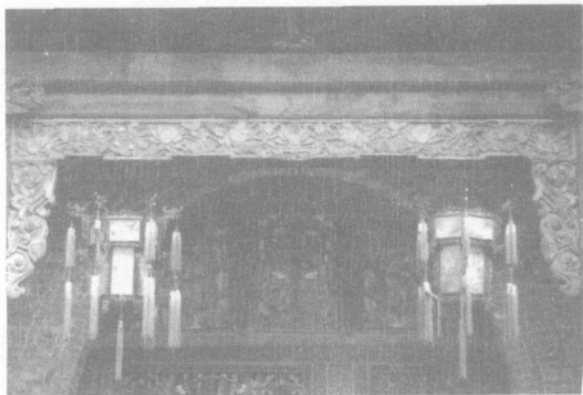
木雕挂落 五婴戏莲

王家大院三雕艺术题材广泛,内容丰富,有人物(包括历史人物、戏曲人物、神话人物)、吉祥花卉、珍