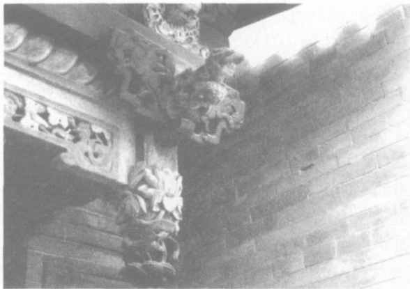
垂花门垂柱上的雕花鸳鸯荷花及狮子滚绣球

品清廉,五心者称五子莲,五婴戏莲或即取此意。故此,在儒家来说,有鱼穿莲 男根崇拜,拙作《鱼莲文化装饰与生殖崇拜》已有阐述),麒麟送子,道家则有仙鸡送子,天仙送子,佛家则有天王送子,千叶化生,民俗则是化生童子,都是将儒道佛捆绑在一起,期盼多子多孙,家族兴旺,科举高中,一举成功。