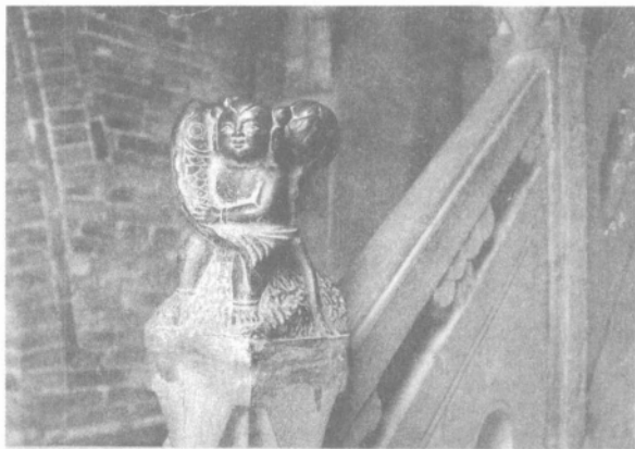
石雕望柱 连年有余

科学、细致、认真的设计，不是单纯的为艺术而艺术，为好看而设置。木雕砖雕石雕所处的位置不同，雕刻的题材和技法也各有差异，做到了合情合理，有的放矢，把建筑的坚固性和审美性的愉悦性，有机地结合在一起。木雕多用在挂落、斗拱、窗棂、帘架、门楣、翼拱等部位，并加以彩绘，使建筑空间绚丽多彩，玲珑剔透，富丽堂皇。石雕多用在建筑物的基础部分，和地面最为接近，用浅浮雕或用线刻雕出，使建筑有坚实、稳固、厚重之感。砖雕则多在墀头、影壁、看面墙、槛墙以及望兽、吻兽等构件上。石雕砖雕与木雕大异其趣，保持了天然色质，清淡朴实，醇雅厚致，亲切自然。在同一座院内，既有儒家布衣白屋思想文化的体现，又有豪门巨富显赫人生与财富的炫耀。从技法上看，有圆雕、半圆雕、高浮雕、浅浮雕、阴刻、阳刻、混雕等。视线高低不同，雕刻技法也有差异，石雕山水影壁为平面阴刻，线条表现丰富，有中国画线