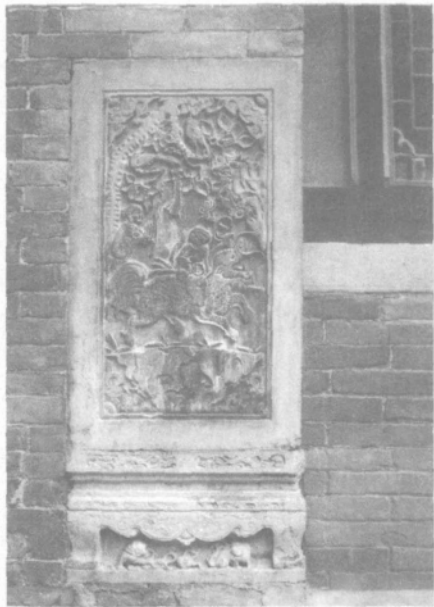
石雕墙基石 麒麟送子