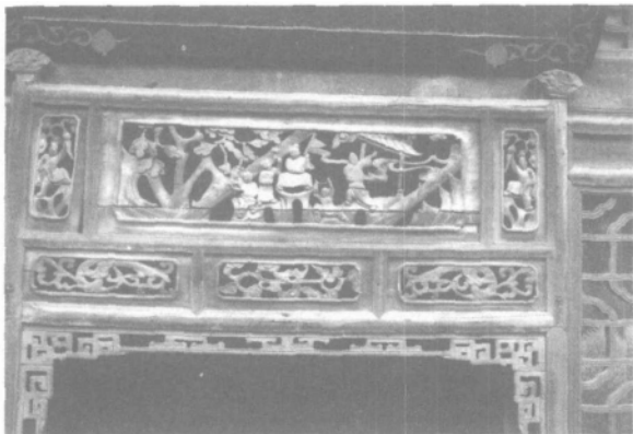
木雕帘架 五子戏莲

主要是受孔孟“不孝有三，无后为大”的思想影响，一直延续到封建社会末期。儒家的礼制文化，是由远古的生殖崇拜和自然崇拜发展来的。儒家主张“忠君报国”“修身、齐家、治国、平天下”。它的内核是祖宗崇拜和山川崇拜。这就是说，在封建社会，家庭是最基本的社会单位，所以历代封建统治者们，都主张先要修养身心，整治家族，才能达到保山保河保社稷的目的，家族兴旺，国家才能强盛。