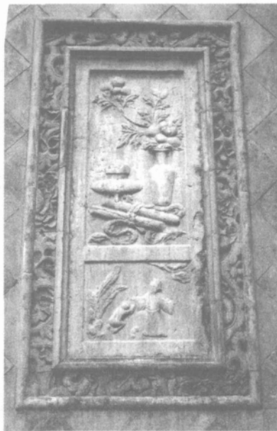
牡丹及牡丹花神——李白

文气雅气书卷气十足的高浮雕“四爱图”和四季花卉司花男神,更值得称道。四爱分别指黄山谷爱兰,陶渊明爱菊,林和靖爱梅,周敦颐爱莲。兰花奇香扑鼻,有香祖、王者香、天下第一香之称。由于它生长在穷山僻野,不与群芳邀宠,不求闻达于世的品质,历来受到人们的重视。《周易》曰:“同心之言,其臭如兰”。《楚辞》也以兰喻君子的高洁。黄山谷为苏门四学士之一,又为苏门六君子,还是宋四大书法家之一,“君子之交淡如水”,黄山谷是君子,兰也是君子,兰就是黄山谷,黄山谷就是兰。周茂叔最先发现莲花有君子之风格,在《爱莲说》中赞莲花“出淤泥而不染,濯清涟而不妖,中通外直,不蔓不枝,香远益清,亭亭静直,可远观而不可亵玩焉。”陶渊明因不为五斗米折腰事权贵,挂印玺辞归故里,十分偏爱菊花,每年重阳日,必入花丛中赏花,在《饮酒》诗中写道:“采菊东篱下,悠然见南山……此中有真意。欲辨已忘言”。南宋伟大诗人辛弃疾说:“自有陶潜方有菊,若无和靖便无梅”。林和靖名逋,北宋诗人,和靖是其谥号,一生淡泊名利,不娶不仕,隐居西湖孤山种梅养鹤,人称其是“梅妻鹤子”,真宗皇帝知道后,昭示本地官员逢年过节登门慰问,林逋去世后赐谥和靖先生。他在《山园小梅》诗中名句:“疏影横