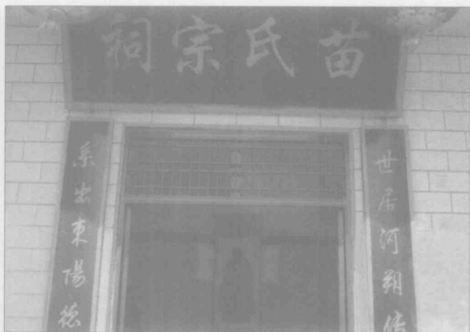
武陟县大封镇苗氏宗祠

元末明初，战乱纷起，苗姓又被迫迁徙。据江苏沛县等地《苗氏族谱》载：元末明初，河南永城县东四十里苗桥苗氏家族，分七支向外迁徙：一支迁汴京（今开封），一支迁夏邑，一支迁江苏沛县，一支迁山东，一支迁安徽，两支迁山西。明初，政府从山西向河南、河北等地大规模移