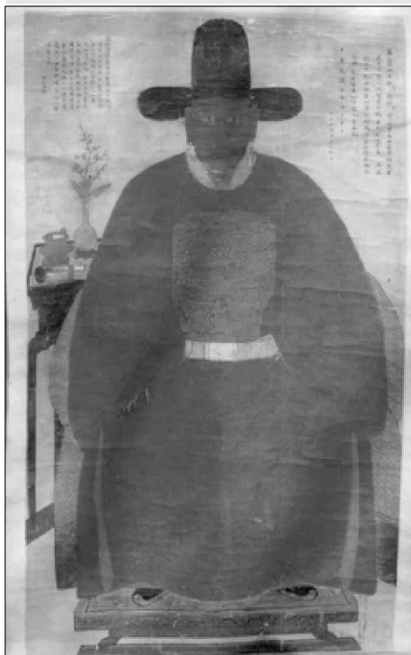
明代郑州典仪苗越画像