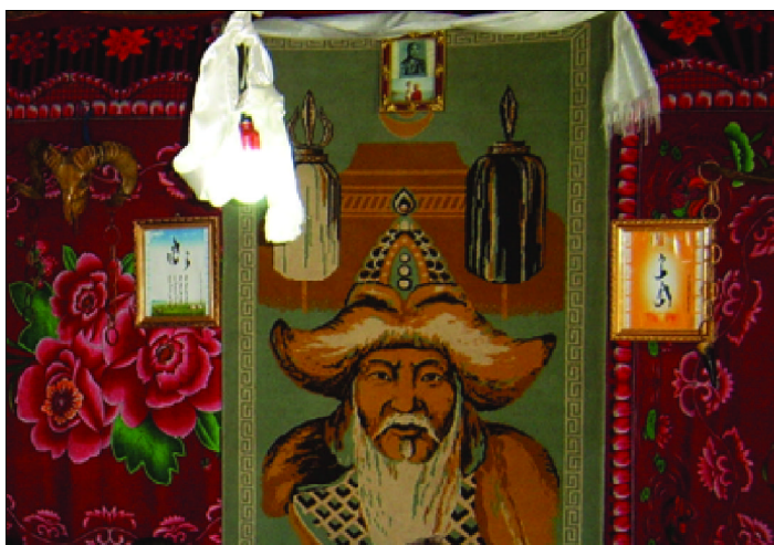
图瓦人家的客厅挂着成吉思汗画像

大约在成吉思汗出生的两千年以前，北方草原上一个叫蒙古的部落与突厥族经常发生战争，结果蒙古部遭到了毁灭性的打击，整个部落只剩下两男两女，逃进了一个叫“额尔古涅昆”的大山里隐居起来。他们在这个自由的天地里结为夫妻，繁衍子孙，遂形成了以“乞颜”为名的