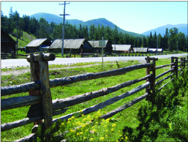
俄罗斯建筑风格的民居

“ 禾木 ”最先是熊的图腾替代 ,然后是人熊互化 ,成为本部族具有血缘关系的祖先神 ,对其族人具有凝聚力、保护力。图瓦人相信图腾物( 山与禾木 )具有某种神秘的力量 ,只要部落对“ 神山 ”进行祭祀和对“ 禾木 ”表示崇拜 ,它们就会尽力维护部落的生存繁衍 ,并保护他们不受自然界其他灾害的威胁和伤害。这在图瓦人三大节气中的“ 敖包节 ”中也有反映 :每年的六月二十日这一天 ,在一棵被尊为“ 树神 ”的树上绑一根布条 ( 以白色为主 ) ,然后再用石块或土块堆在树的四周 ,参加者不分老少都要向它