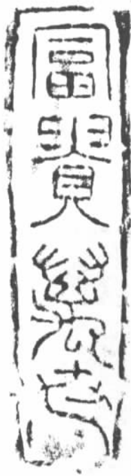
图八-1 “富贵万世”铭文砖拓片

《三国志·吴书·宗族卷第六》记载,孙邻卒于赤乌十二年(249年)。其祖父孙羌,系孙坚之兄,父孙贲,曾先后任过郡里督邮守长、豫州刺史、丹杨都尉兼征虏将军、九江太守、豫章太守,封为都亭侯。孙邻9岁接替父亲统理豫章,进封为都乡侯,任郡守职务近20年,后被召回武昌,任绕帐督,之后又改任夏口沔中督,威远将军,南京富贵山东晋墓,墓葬总长9.76米,简报认为“富贵山大墓无疑是当时上层统治阶级的墓葬,也可能是王陵” [28] ,南京大学北园东晋墓 [29] ,南北总长8.04、东西总长9.9米,墓主身份可能是一个地位很高的封建贵族。宋山墓应该是已经发掘的六朝墓葬中规模第二大的一座墓葬(2007年1月19日《中国文物报》刊登《南京上坊孙吴墓考古取得重大收获》一文,文中记载南京上坊孙吴墓墓室长20.16米,应该是迄今发掘的六朝墓葬最大者)。六朝考古专家蒋赞初