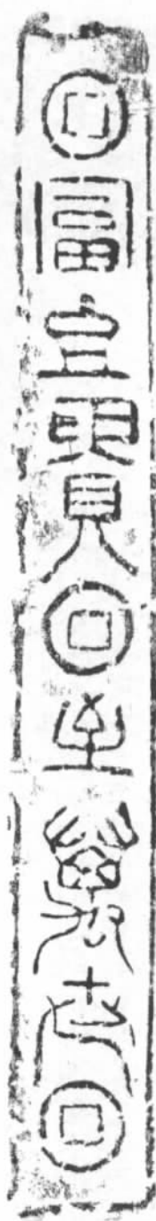
图七/ “富且贵至万世”铭文砖拓片

2. 甬道分为前后两部分,前甬道小而窄,后甬道大而宽。此种甬道分前后两部分的形制到西晋晚期至东晋才开始流行,但两者中间却多加有木门或石门。如南京北郊东晋温峤墓 [13] ,甬道前部分宽且高于后部分,中间是门槽;南京市铁心桥王家山东晋晚期墓“甬道平面为长方形,约可分前后两段,前段略宽于后段,高度相同” [14] 。显然后来分前后两部分的甬道形制是受宋山墓这种甬道形制的影响,并在此基础上演变和发展而来的。