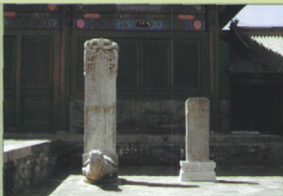
修缮后凝禧殿前明弘治及清康熙年修缮记碑

进入神乐署院落，首先映入眼帘的是一座巨大的红色影壁。转过影壁，跨入神乐署院内，就是神乐署的正殿——凝禧殿。大殿五开间，歇山顶，绿琉璃瓦庑殿顶，五彩斗拱，殿前有月台，非常宽广，这里依然留有昔日祭祀乐舞生演练时的站位，殿前竖有明弘治及清康熙年间修缮神乐署的碑记。如今，凝禧殿开辟成为中和韶乐展演区，专用于演奏雅乐。金碧辉煌的舞台，古香古色的氛围，在朴素而缓和、神圣而高雅的雅乐声中，仿佛时光回转，让人不禁回想到礼制森严的封建时期，一言一行、一举一动都变得谨