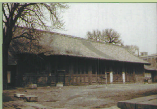
修缮前的神乐署显佑殿