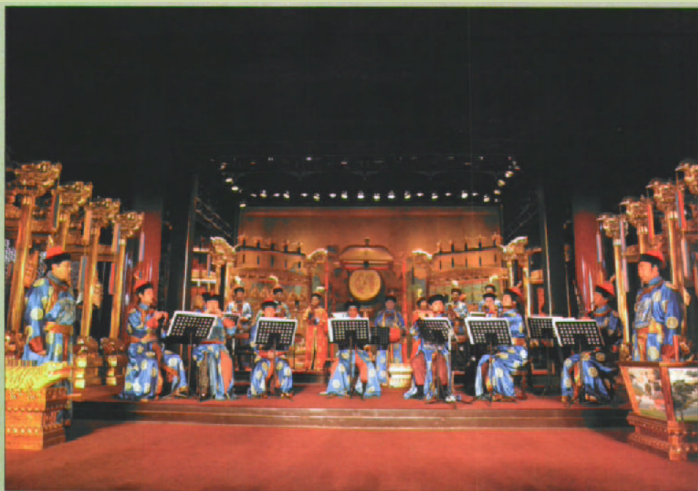
神乐署凝禧殿内的中和韶乐演出