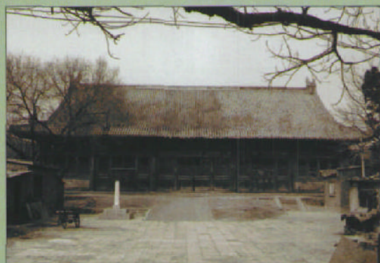
修缮前的神乐署凝禧殿