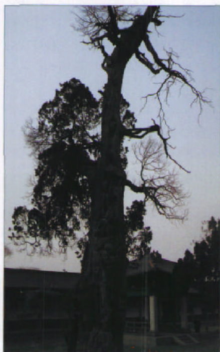
济渑庙内的将军柏