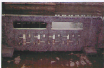
灵渊阁前的石勾栏