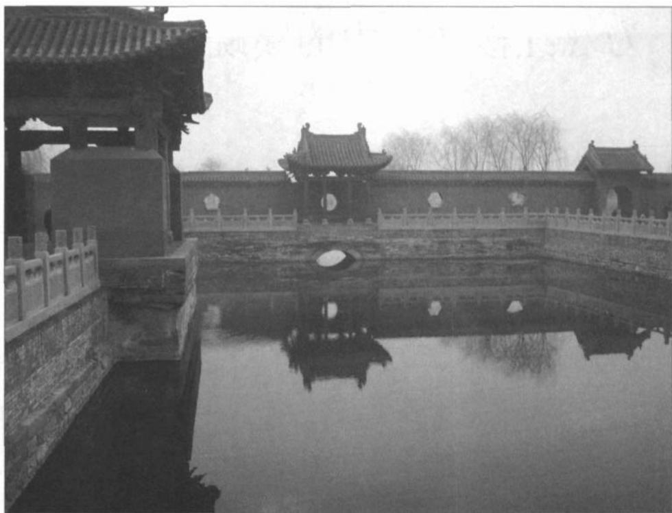
济水发源地——济渎池

贵？济水平地开源，界空正绿，表里皆净，似若非深，舟楫既加，乃知无底，冲和自挹，斯君子之德欤？从而东，截河道汶，不以险阻断其势，不以清浊汨其流，终能独运长波，涛涛入海，沉潜刚克，斯君子之量欤？”济水的这种高洁精神不会因为济水本身的衰落和变迁而消失，反而作为历代文人志士毕生追求的最高精神境界及修身准则，和历朝皇帝御制祭文中的中心内容，永远流传万世。