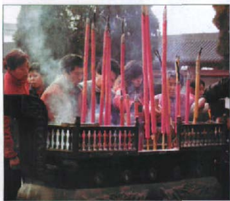
济渎庙内香火鼎盛

朝廷对济水清德的推崇和重视，使得济渎庙历代增修，规模不断扩大，香火鼎盛。自隋开皇二年创建开始，开皇四年扩建了天庆宫和御香院。唐贞元十二年（796年）时，因为北海远在大漠之北，祭祀困难，便在济渎庙后面增建了北海祠，把北海神附于庙内，所以济渎庙全称为济渎北海庙。此后唐、宋、元、明历代不断扩建，明朝时济渎庙内的建筑已达到400余间。建筑规模扩大的同时，历代朝廷对济渎神的封赠也不断增加，祭祀规格也不断提升。唐玄宗天宝六载（747年）加封济渎神为清源公。宋徽宗宣和七年（1125年），济渎神被封为“清源忠护王”，元仁宗时封济渎神为“清源善济王”。到明代，太祖朱元璋对岳、渎封号进行了一次改革，封济水神为“北渎大济之神”，革去了历代关于岳渎的溢美之词。以其