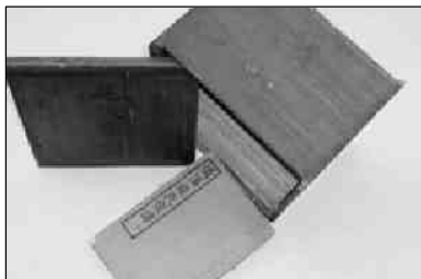
《烛溪施氏宗谱》书影

甚至可以认为,在中国以往的史著中还没有其他著作比家谱更直截了当地强调‘致用’性。”“致用”,则非资料莫为);古籍多刻本,活字本少见(《中国古籍善本书目》收录清末以前古籍56787种,活字