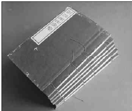
《九江朱氏家谱》书影

畿省州县定居方疆域之殊， 祠宗书院作承先启后之法。 牌匾坊额赐第宅旌封之恩， 坟墓祀田显先德世守之业。 姓氏名地示奕叶流泽之长， 里社乡塾端重本养蒙之实。 这样的分类多见之于安徽地区家谱，