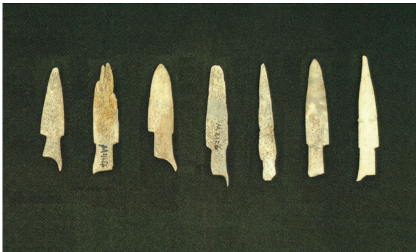
杀害零口姑娘的凶器

需要说明的是，在7000多年前的新石器时代早期，锋利实用的骨叉、骨镞、骨筭还是比较珍贵的。