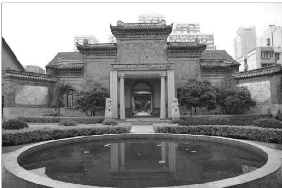
移建后的陶林二公祠