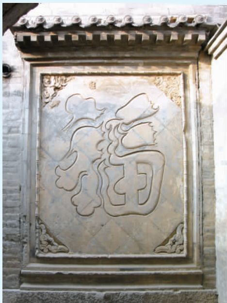
图四 李贵乾东院照壁

独特,具有明显的地方特征,是房主人和能工巧匠共同智慧的结晶,它既传承了山西传统民居做法,又根据当地自然气候、地质地貌、风情民俗因地制宜建造出适合当地条件的民居建筑。