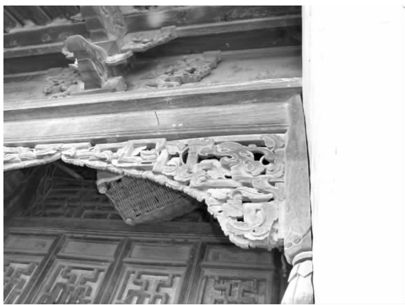
图一三 李贵乾西院门楼木雕雀替

前后檐墙,出头平直截取,由两墙承屋顶荷载,五架梁上立瓜柱承三架梁,三架梁头托金檩,中部立脊柱,设短替承脊檩,脊檩两侧以叉手支撑。脊瓜柱头纵向置顺脊串连构。