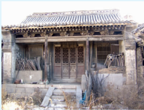
图七 李氏祠堂正堂