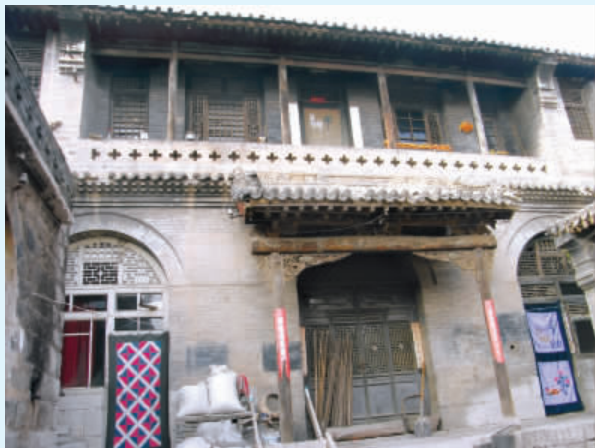
图六 李贵乾院正楼

(2)天聚生李氏祠堂院大门作屋宇式,平面近似方形,不设木柱,两侧砌山墙,门道两山墙内中部置抱鼓门枕石,石上装槛框,中槛上装走马板。大门为