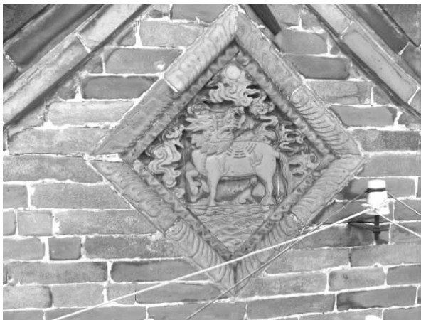
图一一 李贵乾西院门楼山墙砖雕