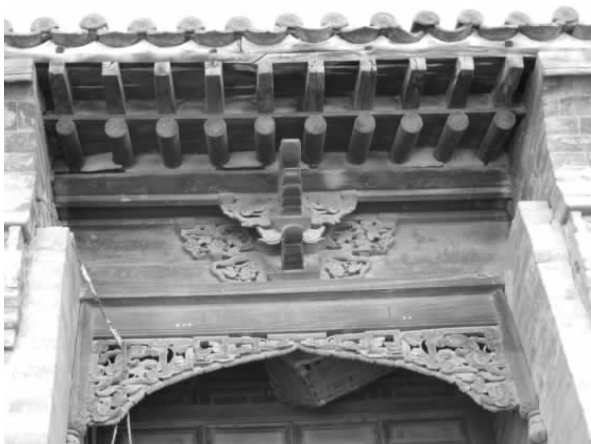
图一二 李贵乾西院门楼木雕斗拱