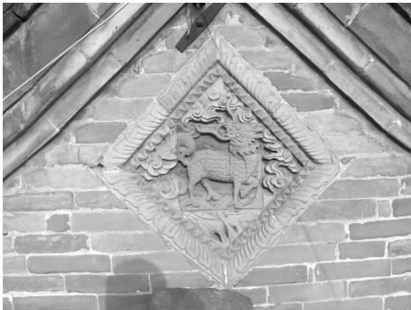
图一〇 李贵乾西院门楼山墙砖雕

天聚生李怀乾前院东厢房(图五),平面长方形,面宽三间,进深一间,建在20厘米台基之上,台明前砌青石质压沿石,后墙、两山墙砌墙封护,前墙明间设门,两次间为窗。山墙前端置及明间两侧前墙出穿插枋,穿插枋出头装翼形拱,翼形拱作云形。穿插枋承垂莲柱,柱间装额枋、平板枋。明间五架梁通达