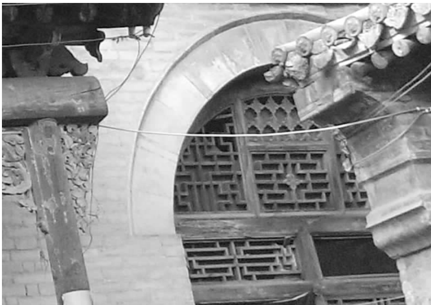
图一五 三号院正楼窗棂

杆条玻璃屉,上作正交卐字图案。二层明间作板门,顶窗作拐子锦。次间作窗,窗棂中间为正方格,两侧及顶窗作步步锦。梢间亦作窗,窗棂上、下均做正方格,下大上小。