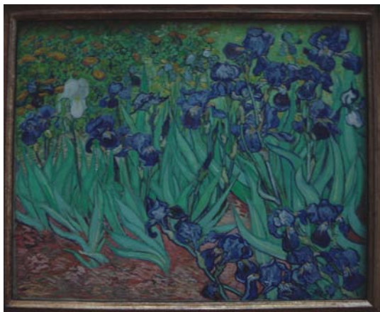
盖蒂艺术中心藏画《鸢尾花》

此处展品丰富，有雕塑、油画、家具、古书、器物等等，无一不精，也无一不珍，显示出收藏者过人的眼光。展品中有大量的古抄本，其上手绘插图，色彩线条，精美异常，让人惊异不止。在古书古纸画陈列处，光线稍暗，为的是怕光照过强使纸张发脆。看