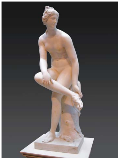
盖蒂艺术中心雕塑藏品：希腊女神

参观盖蒂艺术中心，是免费的，但是停车则须花费十美元。如果你尚是囊中羞涩的一介平民，步行或乘大巴而来，完全可以与驾豪车者同样昂然而入。这座建于山顶白色的建筑群，格调高雅，环境优美，由世界著名的设计师设计。成千上万块珍贵的白色大理石，来自遥远的意大利。蓝天下洁白的建筑，纤尘不染，联接各展厅的高大走廊，外侧多是大玻璃窗，可以眺望洛城远景，有些窗户上蒙以薄纱，窗外山川秀丽，微带朦胧，行走其间，宛若参观一幅幅优美的画图。中心的花园鲜花纷飞，碧草如绒，以钢筋编成的巨大花篮，盛开着大簇大簇紫红色的三叶梅。艺术家匠心独运，调动景物的光线、色彩、形体、质感，使之移步换景，无处不美。特别是将现代工业元素揉入