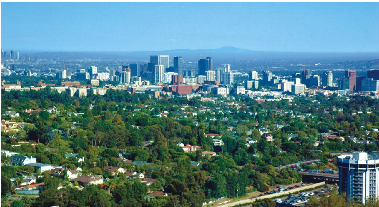
洛杉矶市中心远眺

金秋时节，天朗气清，陕西省文物局学术代表团一行四人，赴北美西海岸，参加中美学术交流。