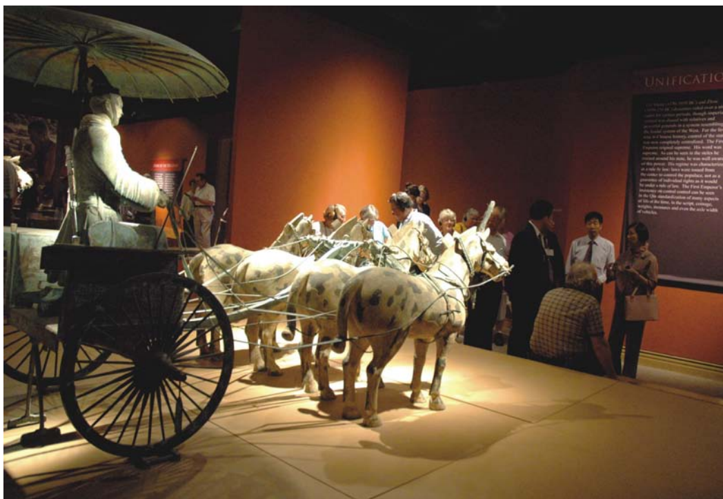
宝尔博物馆展出的秦俑铜车马

丰富的历史文明，通过这种文化的相互交流，让两国之间更加增进彼此了解，加深两国民众友谊。