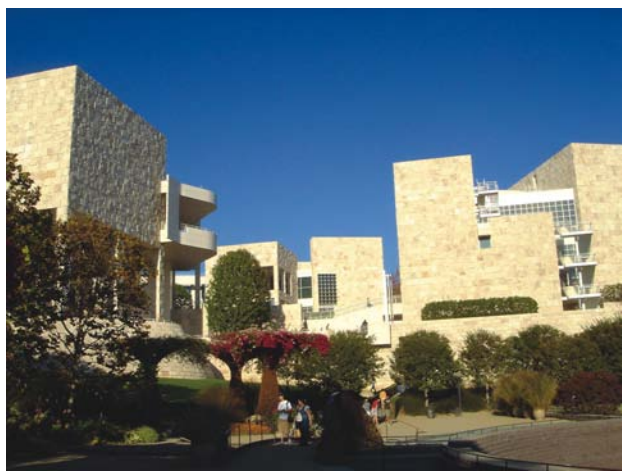
盖蒂艺术中心局部

长文化的一个小小章节。我们不仅仅有兵马俑，不仅仅有秦始皇陵，我们还有更多的优秀文化，周秦汉唐，数千年的文明积淀。中国与外界的文化交流与展示，还应当不断拓宽。要让世人了解中国，更全面地认识中国文化，还有很多事情可做，还有很长的路可走。除了此类文物的展示外，历史上难以保存的土木建筑，和更多的文物内涵，也可以运用其它手段进行介绍。要利用兵马俑热展，向美国人民乘机推介中国