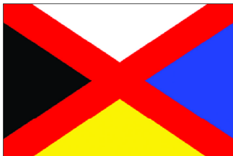
袁世凯称帝时使用的中国帝国国旗

但孙中山却执著地钟爱青天白日满地红旗。1907年潮州黄冈起义、惠州七女湖起义、钦州防城起义、镇南关起义，都以此为旗帜。黄兴虽与孙中山在国旗上持不同意见，但行动上还是坚持孙中山的主张。1908年的钦州上思起义、河口起义，1911年的黄花岗起义，黄兴打的都是青天白日满地红旗。