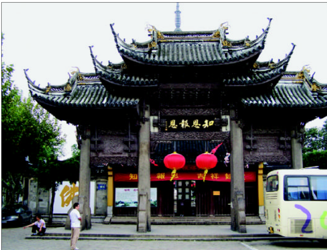
苏州北寺塔知恩报恩牌坊

意，且有祝福读书人也“棣星高照”的寓意。文庙棣星门为六柱三门四壁出头的青石牌坊，冲天柱云冠雕饰盘龙，下立抱鼓石夹杆，柱间有额枋两道，雕行龙、翔凤、仙鹤，并饰有日月牌版和云版。四堵砖壁以九方清石板贴面，呈井字形，中央雕牡丹和葵花图案，四角饰卷草如意纹，上覆瓦脊，下承石须弥座，石雕浑厚刚建，粗中有细，为明代牌坊。