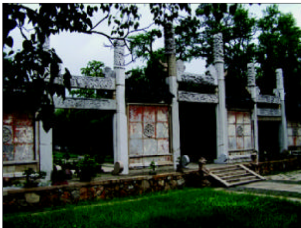
苏州文庙棂星门牌坊

棂星门可以说是文庙的必备建筑。“棂”是窗格子的意思，有了窗格子，天上的“棂星”才能透过窗户射进来，给读书人带来好运，这就应了古时读书人“十年寒窗苦”，祈求棂星带来文运之