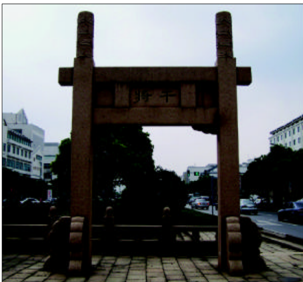
句吴神冶牌坊之“干将”

“句吴神冶”牌坊位于苏州干将路上，两侧各有一个小牌坊，左书“濂溪”，右书“干将”。干将既是历史上有名的铸剑工匠的名字，又是一把绝世宝剑的名字。在牌坊东面的路，以前叫濂溪坊。据《宋史》记述：周敦颐，别号濂溪老人，居苏城资寿寺侧，建“濂溪书院”讲解道学，歿后众人念之，改宅为祠，名濂溪祠，并将巷名“布德坊”改为濂溪坊。1994年拓宽干将路时，濂溪坊被拆除，为保留此巷名，建一座