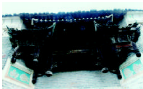
根本堂精美的雕花悬柱门罩

值得一提的是,“蟠桃百寿祠”自建造伊始,就将光大文化教育理念纳入了总体构思之中。文昌院大门上,高悬“文昌宫”巨匾。而作为主建筑的根本堂,同时又是刘棋占以其父号命名的“简文书院”。堂中木枋上精工雕饰的书页中,以楷书或篆体浮雕着张继的《枫桥夜泊》、王维的《早朝大明宫之作》等唐诗宋词及儒家伦理格言。而富有哲理、充满生活情趣及人