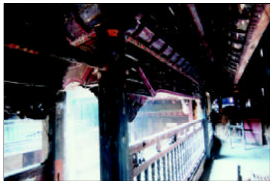
曾用作私塾教舍，俗称“跑马楼”的根本堂楼内一景

生价值观念的楹联，举目皆是。如根本堂正门外取《论语·雍也》篇中“知者乐水，仁者乐山”之意所撰的“知水，仁山”；充满教育意蕴的“质映南金，秀标东箭”；“江山满词赋，星斗焕文章”；表现生活情趣的“烟霞共远，风月无边”；“芝兰满室，鱼鸟亲人”；直抒胸臆，表达人生哲理和价值观念的“明体达用，致远通方”等等。