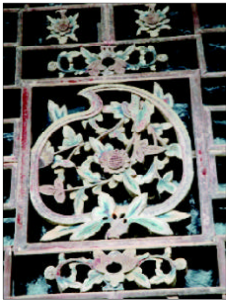
文昌院馆舍窗棂上的“蟠桃菊花相映图”纹饰

取法仙桃的构造布局是“蟠桃百寿祠”最为奇特的建筑形式。其南半部由主建筑根本堂和文昌院庭院部及后侧组成，呈纵向矩形。其北部由涉趣园和包含其中的文昌院馆舍部组成，以涉趣园围墙按“桃尖”、“桃腹”、“桃底”曲线蜿蜒相接而成。整个建筑群落近似桃形，象征并表达主人祈求“延年益寿”的愿望。