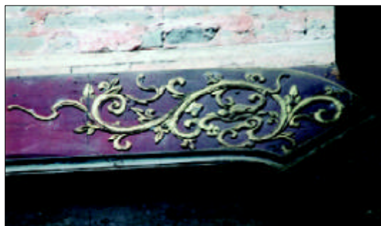
罕见的鎏金“龙首凤”图