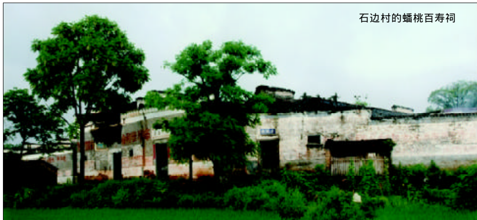
石边村的蟠桃百寿祠

与外在形式具有隐含不露的象征手法形成鲜明对照的是,“蟠桃百寿祠”在建筑构件的雕饰中,大肆张扬以长寿为题材的主旨。根本堂雕饰中大者径逾尺五、小者长不盈寸,且写法各异、无一相同的101个“寿”字,遍饰堂内的巨枋、天花、窗棂。文昌院中曾雕饰在回廊、亭阁、馆舍漏窗上的百余枚蟠桃,姿态各异,生动如鲜。而在根本堂大厅前方顶部的巨大长枋上,则以长达2米的幅度,鎏金精工浮雕气势雄阔的“郭子仪祝寿图”。图中以省略大部背景画面,着力刻画人物神形动姿的高超艺术手法,表现唐代汾阳王郭子仪及夫人端坐案前,接受十余名文武官员献寿时的盛况,并以此寄托建屋主人刘棋占本人的希冀与向往。