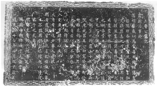
图二 《三晋公寓记》碑文