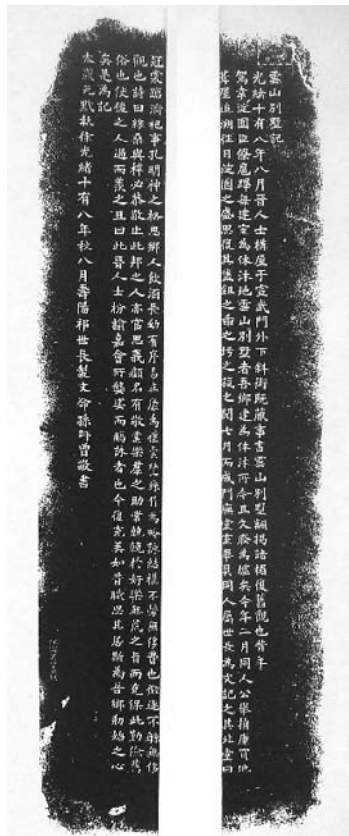
图四 《云山别墅记》碑局部

在查访以上三处会馆遗址和碑记中，笔者深深的感到碑文是记载历史的最好证据，是一种珍贵的文化遗产。上述碑记是研究山西会馆乃至三晋文化的证物，可惜其本身已经无存，幸运的是国家图书馆还保存着它们的碑拓，文字清晰，犹如原碑再现。碑文记载着许多宝贵的信息，如会馆创建的年代、地址、规模，何人提议创建，为什么要建。使我们仿佛看到它曾经的辉煌和荣耀。还记着清代早期杰出人才陈廷敬、孙嘉淦、阎若璩、傅山等名人，对社会所做出的贡献以及山西人的传统美德：“晋自唐叔肇封，水深土厚，人物敦庞，务本崇俭之风至今未改，务