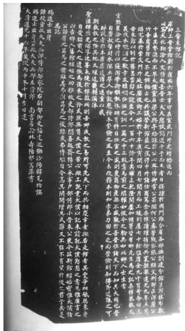
图一 《三晋东馆记》碑文