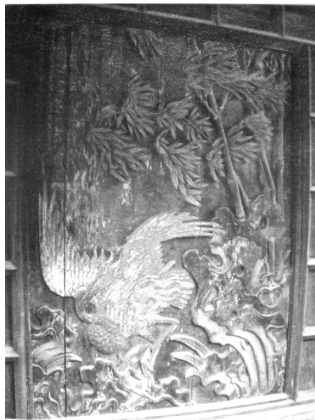
图四 山西襄汾丁村养正堂古民居中木雕《风竹鸣鹤图》影壁

明朝画家吕纪的名作,怎么会雕刻在丁村养正堂照壁上呢?这在养正堂木雕影壁的题记中,可以窥见一二。其题记:“顺治丁亥世祖章皇帝颁赐廷臣敬为勒刻永矢宸恩前中书科中书舍人历官光禄大夫都察院左副御史加从一品臣上官鉉 [5] 大清康熙二十年岁次辛酉孟冬吉旦雍正辛亥花月望八日养正堂立”。