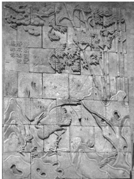
图一 清砖雕《风竹鸣鹤图》影壁 明吕纪绘

本世纪初在北京吕家营山西摊位上发现的这幅由 38 块砖雕组成的“风竹鸣鹤图”(以下简称“鸣