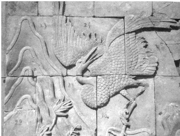
图三 清砖雕《风竹鸣鹤图》影壁下端细部