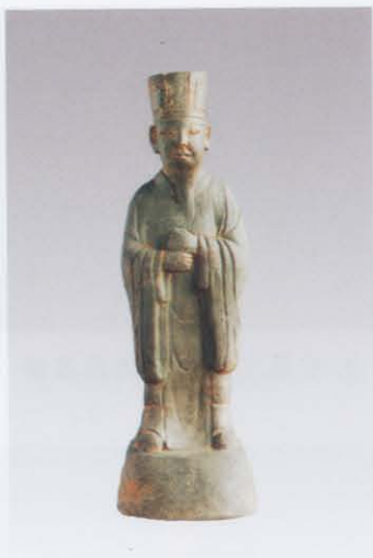
2. 文官俑 (左: 6)