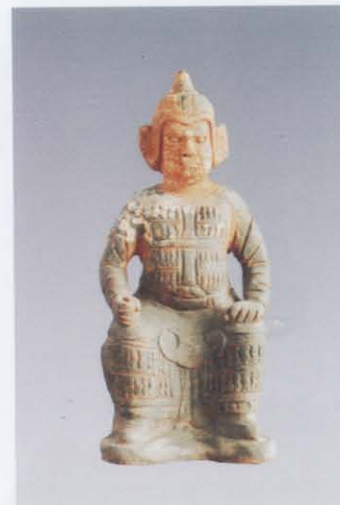
6. 将军俑 (右: 21)