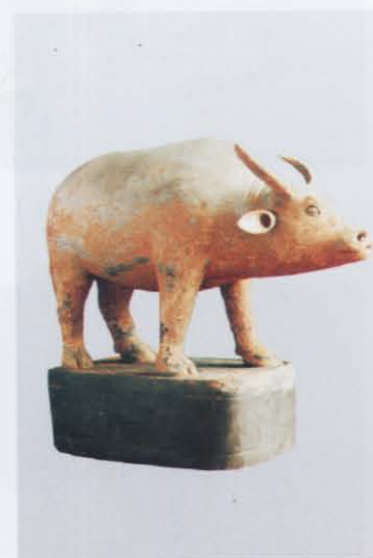
7. 陶牛 (右: 19)