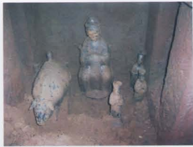
3. 左墓室后壁龕随葬器物