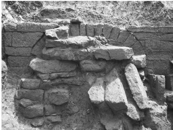
图一 右室墓门(南-北)

双室石室墓,墓向 15^{\circ} ,为四川地区常见的夫妻同坟异穴合葬墓。东侧为右室,西侧为左室,