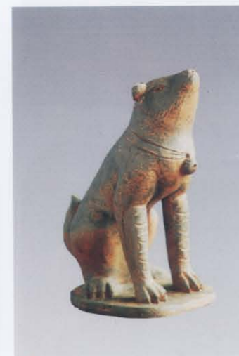
9. 陶狗 (左: 25)