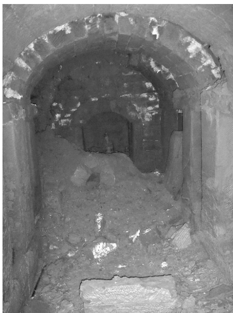
图二 左墓室清理前(南-北)

左右墓室各有墓门,两室间共用墓壁,近墓门处有一过道相通。圆拱形墓门,门框用两平一竖的条石砌成,至 1 米高处开始起券,门洞高约 2 米,券拱