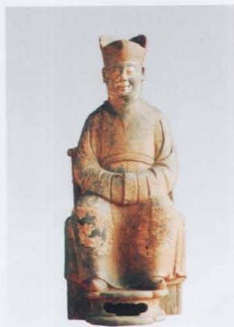
4. 男墓主人像 (右: 18)