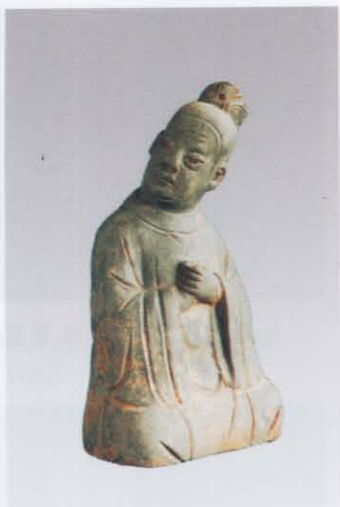
1. 坐听俑 (左: 24)