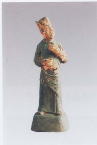
3. 执物俑 (右: 14)