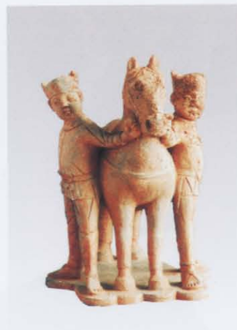
5. 双人牵马俑 (右: 15)