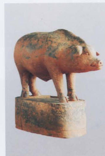
8. 陶猪 (左: 38)