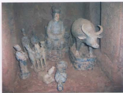
2. 右墓室后壁龕随葬器物