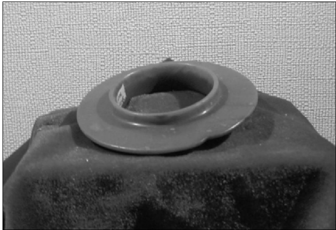
“礼神之璧乃玉之精英”——齐家文化有领玉璧 临夏博物馆

这个传统究竟有多么久远呢？一般认为黄帝时代距今约五千年。那时毕竟没有文字史的记载，今人只能靠传说去推测和理解。20世纪后期，人们在内蒙古东部发现了8000年前的兴隆洼文化玉器，随后有6000~5000年前的红山文化玉礼器体系的崛起，证明早在黄帝