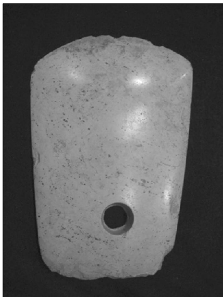
齐家文化玉钺 兰州周照平藏品

我们今天的语言词汇中还依然保留着那个异常久远的时代之痕迹。比如我们日常所说的“切磋一下”，或者“琢磨琢磨”原来都是指制玉的专门词汇。长达三百万年的旧石器时代，猿人先祖们是在“如切如磋，如琢如磨”的石器生产伴随中度过的。换言之，没有琢磨石