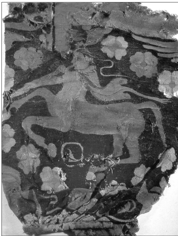
中国的“人头马”，新疆出土毛织壁挂图案。

如果了解到河西地名“玉门”的得名背景就是四千年来不断向中原文明输送和田玉的伟大运动，以及西部的丝绸之路背后更加深远的玉石之路的存在，再审视中国乐园神话与玉文化的关联，就容易理解了。在上古时期的华夏世界观中，关于西部的想象的地理有其鲜明的本土特色，那就是以昆仑乐园为玉文化的神圣源头，发展出一系列的“神玉”观念，将这种先民心目中世间最美的石