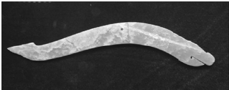
晋国祭祀坑出土玉龙 献给神的礼品。 山西侯马晋国古都博物馆

其次，玉除了礼神，还是远古圣王孜孜以求的神圣美食。《山海经·西山经》：“丹水出焉，西流注于稷泽，其中多白玉。是有玉膏，其源沸沸汤汤，黄