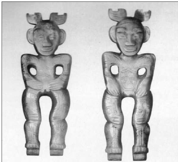
殷墟妇好墓出土玉人

上陨星精，下入渊谷为玉英。”这就把玉英美食的来源从大地上的昆仑山转换到天上去了。唐·王湾《奉使登终南山》诗：“玉英时共饭，芝草为余拾。”这是诗人借幻想把天上的珍稀食物放到了自己的饭桌上。