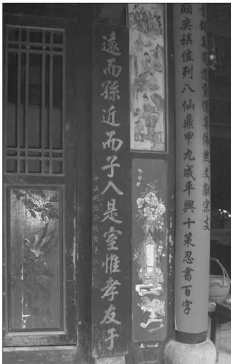
德远堂大厅红柱上的长联

篇”指的是北宋唯物主义哲学家张载，其一生著作中以《东铭》、《西铭》两篇流传最广；“辅汉三杰”指的是辅佐刘邦建立西汉王朝的萧何、韩信、张良；“功高四相”指的是唐中宗时张柬之做宰相，唐玄宗时张嘉贞、张说、张九龄先后为相，四相均有政绩；“敕封五虎”指的是《三国演义》作者罗贯中所虚构的关羽、张飞、赵云、马超、黄忠受封为五虎将的故事，张飞受封为车骑将军；“博物六史”指的是西晋张华著有《博物志》六卷；“貂冠七叶”，其中貂冠是汉朝宦官礼帽，七叶即七代，东汉十常侍张让名列第一，地位相当显赫；“仙列八位”指的是神话故事中八仙之一的张果老；“鼎甲九成”指的宋朝张