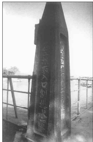
晋江施世榜在台湾创建八堡圳

施世榜在台湾最大贡献是开垦农田，兴修水利，发展农业生产，造福台湾人民，荫及自己代代子孙。其父施