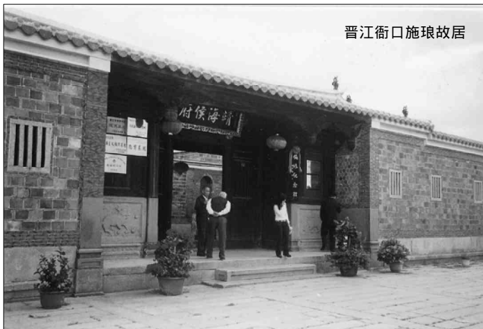
晋江衙口施琅故居

清光禄大夫太子少傅靖海将军襄壮侯施公，一品夫人王氏、一品夫人黄氏赐莹”。墓道由南而北依次有石狮、石羊、石虎、石马，翁仲（二对），钦赐祭葬石碑等，规模恢宏，布局严整。琅次子施世纶墓也在邻近许田村顶庭山上，为县文物保护单位。