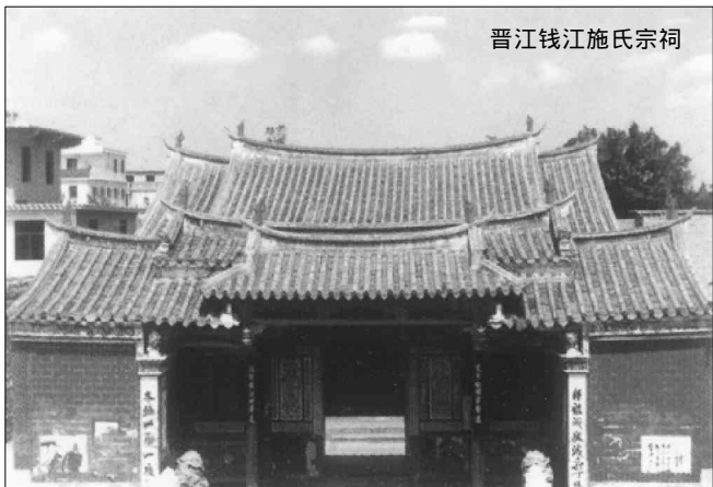
晋江钱江施氏宗祠

世纶显赫勋绩，联曰：“将军靖海收疆土，宝岛朝宗入版图。”“勋德齐班马范曹”匾，悬于施琅专祠中厅，系康熙谕嘉施琅之词，称其功勋德行与汉名将班超、马援，宋名臣范仲淹、曹彬相媲美，同因靖边固疆而彪炳史册。“天下第一清官”匾，悬于中厅，系康熙对施世纶之褒词。施世纶（1659～1720年），琅次子，历官知府、布政使、户部侍郎、漕运总督，清白自持，始终如一。“性警敏，听断如神”。《施公案》小说中之施公即其原型。《浚海施氏大宗谱》于明嘉靖二十年（1541年）始修，崇祯癸酉年（1633年）修成。其十四代起辈行为：“学为肇进士，国光修至性”，施琅为16代“肇”辈，琅统一台湾，康熙赐“百世字行歌”，正巧“字行歌”10至12字的三字与原辈行21至23代三字同为“修至性”，于是从21代起“修”字辈套入“字行歌”，沿用至今。康熙所赐“百世字行歌”为：“卿位际应侯，文章系业修。至性能纯养，正心得自由。恬淡明素志，宁静似先猷。高风宗古朴，雅化尚温柔。黄中元吉迪，青史