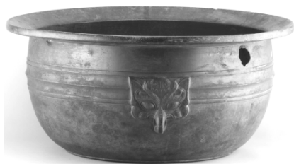
图一 通江东汉铜洗

四川通江县文管所收藏的一件东汉铜洗，质地为铜，高 28 厘米，口径 67 厘米，底径 36 厘米，重 17.8 公斤。合范铸造，胎体较厚，形似大盆，表面呈黑色，敞口，宽折沿外侈，深腹，腹微鼓，平底。上腹饰四道宽窄不等的瓦棱纹和对称的两铺首衔环耳（图一），内底铸有“永元元年朱提堂狼铜官造作”十二字竖行阳篆铭文（图二）。