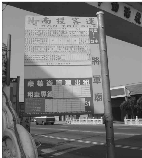
台湾浦里至南投的“将军庙”站

这充分说明，豫、闽、台三地的姓氏在历史上有着千丝万缕的血缘、地缘和文化方面的联系，闽、台地区绝大多数家族姓氏的祖源，都可以追溯到河南以及“光州固始”。