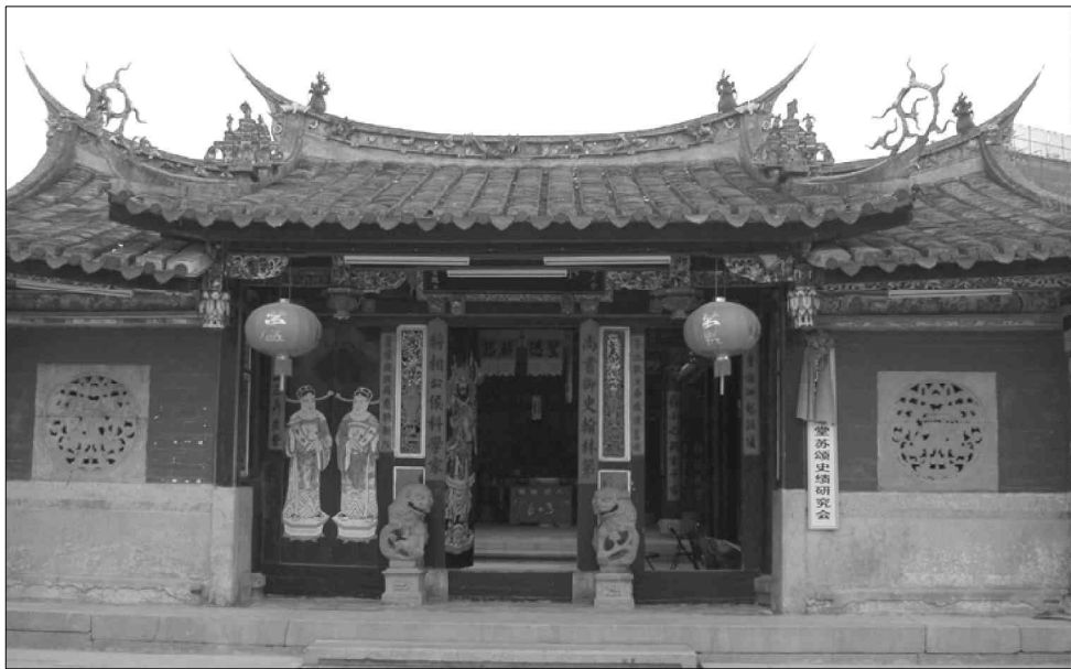
厦门的庐山堂供奉着从固始入闽的苏姓始祖苏益