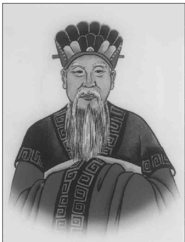
《郑氏族系大典》中的太始祖郑桓公像

幅,贞字辈图像3幅,其中最近一幅贞字辈图像为“贞灿公喜容”,生年为同治元年(1862年)。如果说,始祖、始迁祖的图像是带有想象成分的话,那五服之内近世先祖的图像则比较逼真,因五服之内祖先的音容笑貌及服饰,绘图之人是可能见到或听人描述过的。当浙江剡北灵芝乡王氏族人祭祖时,仰望这些祖先图像,必定会大大加深对这些祖先的印象,从而增强灵芝乡王氏族人的凝聚力和向心力。