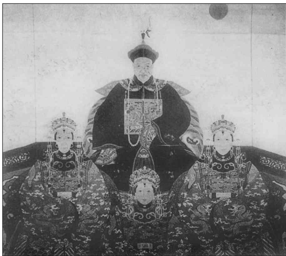
黟县西递家谱中的祖宗容像

又如《(安徽祁门)方氏宗谱》,以姜姓炎帝神农氏9世的帝榆罔之太子雷为得姓始祖,其家谱首卷即列“方氏得姓始祖太子雷公像”。《(福建浦城)渤海西吴宗谱》称宋代吴龙(字起云)为迁浦城始祖,图像标为“宋由浙迁浦始祖尚义冠带起云公遗像”,标题将吴龙在什么时间(宋代)、什么地点(由浙江迁浦城)、家族中地位(始迁祖)均一一标明。