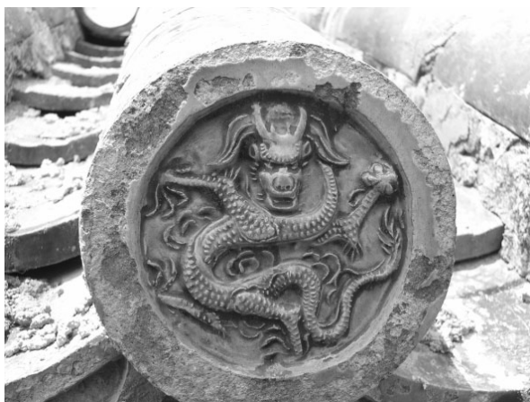
图一四 天贶殿坐龙瓦当

岱庙瓦当符合不同时代的瓦当形制演变规律,伴随着社会经济发展和人们对建筑艺术欣赏要求的