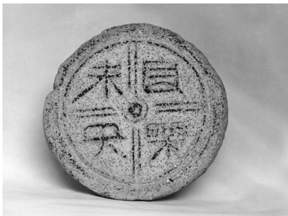
图二 “长乐未央”瓦当