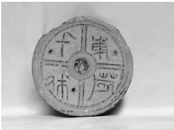
图一 “千秋万岁”瓦当