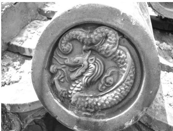
图一三 天贶殿行龙瓦当

1.琉璃瓦当(图一三、图一四)。岱庙主体建筑天贶殿由于不同时代的维修,瓦当饰有坐龙和行龙两种纹饰,坐龙呈正襟危坐的形式,头部正面朝向,四爪以不同的形式伸向四个方向,龙身向上,蜷曲后朝下作弧形弯曲,姿态端正;行龙呈行走状,前设一火球,整条龙为水平状态的正侧面,画面生动活泼。中轴线上的其余建筑如配天门、仁安门等琉璃瓦当均饰坐龙。