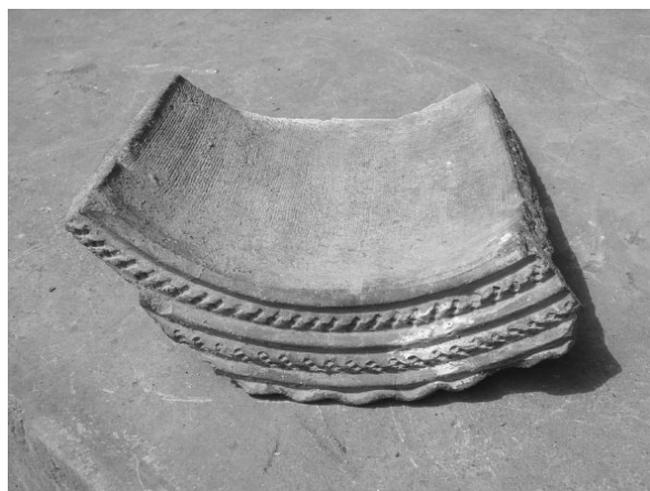
图六 西华门北侧马道出土的滴水