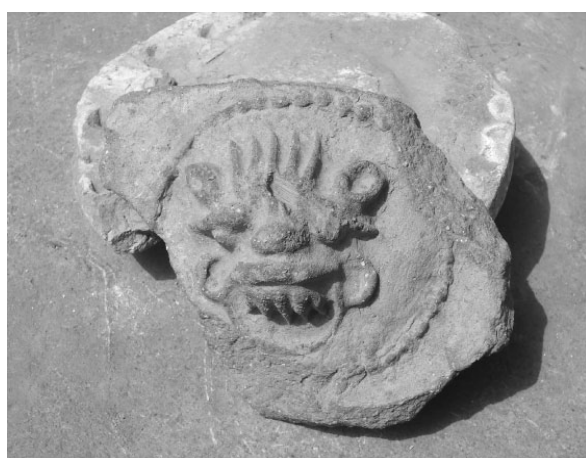
图七 宋元时期兽面纹瓦当