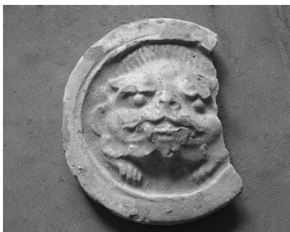
图八 明代兽面纹瓦当

米,当心起圆突,双栏四格界,自右上至左下篆书“长乐未央”四字,其文为吉祥语(图二)。