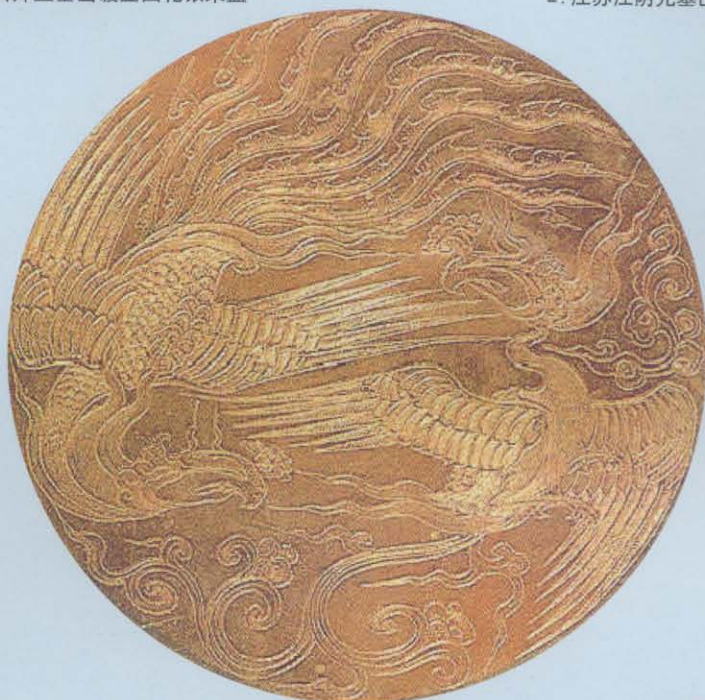
3. 江苏吴县元代吕师孟墓出镀金团花银果盒双凤图案