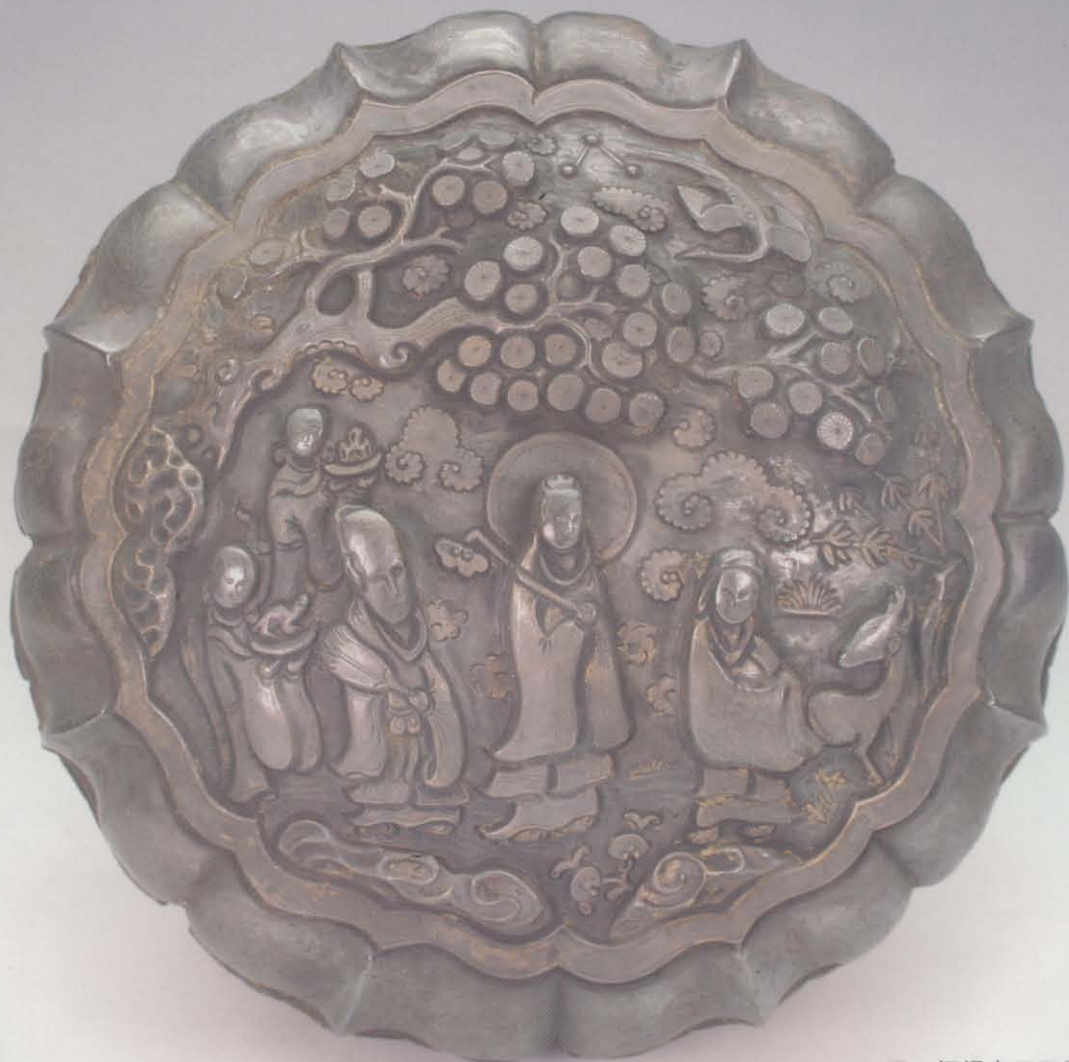
元·福祿寿三星銀果盒