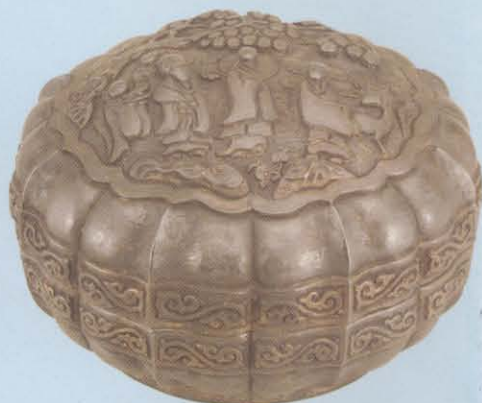
2. 江苏江阴元墓出福祿寿三星银果盒