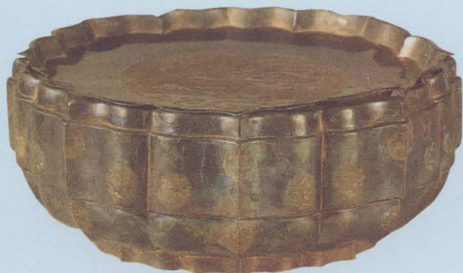
1. 江苏吴县元代吕师孟墓出镀金团花银果盒