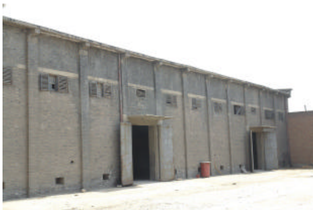
二十世纪五六十年代建造的青砖平顶仓库