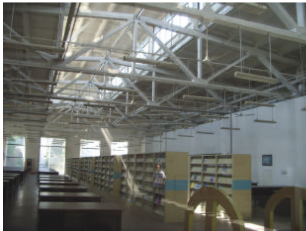
西安建大东校区图书馆一角