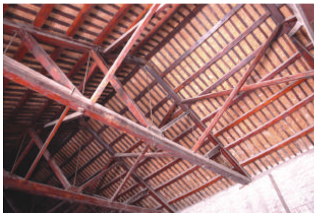
民国时期建造仓库内部木制人字梁