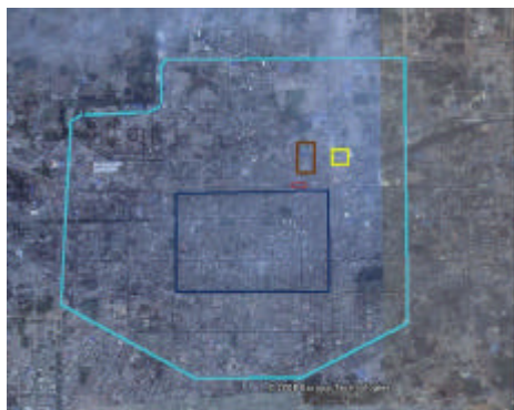
大华纱厂区位图（图中蓝色线为西安明城墙，青色线为西安市二环路，棕色线大致为大明宫遗址区范围，黄色线大致为大华纱厂厂区范围，红色线为现西安火车站位置。）

笔者认为，大华纱厂的保护利用较上述两处西安工业厂房利用实例，有着更为重要的意义。首先，大华纱厂较上述两处西安已利用的工业遗产，具有更悠久的历史，更传奇的经历，更多样的内容。对大华纱厂的保护利用如果能够落实和执行，将再次引发示范效应。相较于历史上的迁厂建厂，这次提升的将是对西安工业遗产保护事业的积极性和关注度。其次，大华纱厂拥有更好的区位条件。前两处已利用工业遗产都地处西安东郊，二环路以外。而大华纱厂厂址位于西安明城墙东北不远，与大明宫遗址保护区核心地带只一路之隔，与未来北移的西安市政府、西安市火车站以及浐灞生态区的距离适中；规划中的西安地铁四号线也将从厂区西侧通过。区位优势，便利的交通，将会给改造利用后的大华纱厂老厂区带来商机与人气。