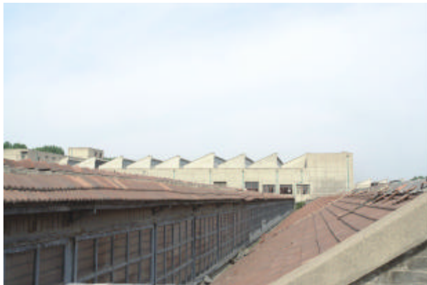
车间顶部采光窗外景