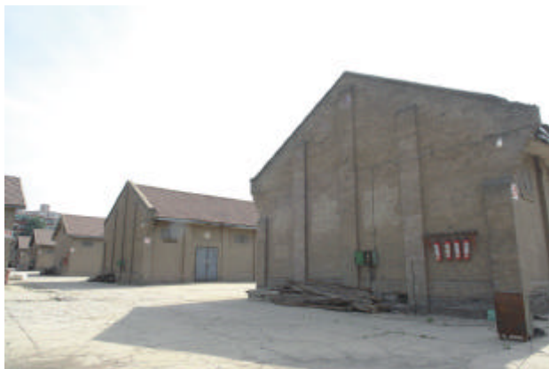
民国时期建造的仓库