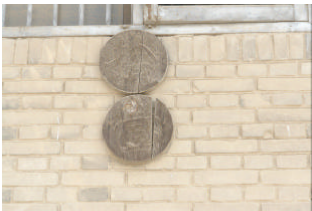
民国时期仓库木号牌（此牌阳刻“拾壹”）