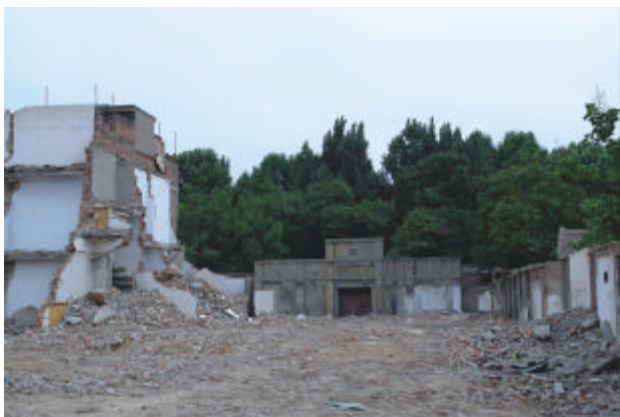
老南门周边环境（面向老南门）

这样一处对于西安十分重要的工业遗产，其价值正在越来越多的被专业学者、广大热心市民所关注和了解。但遗憾的是，老厂区还没有被批准为任何一级的文物保护单位，对于老厂区的保护缺乏法律依据和凭借。由于法律依据的缺失，大华纱厂的创始者，蒋介石的儿女亲家，我国著名纺织教育家、纺织技术家石凤翔的旧居——一栋民国时期的二层小洋楼，已被拆除无存。在2008年4月18日召开的西安市第三次全国文物普查工作动员大会上，明确了将乡土建筑、工业遗产、文化景观、文化线路、文化空间、老字号等文化遗产种类纳入文物普查登记重点，大华纱厂有望进入第七批全国重点文物保护单位名单。目前，西安市城区的文物普查工作正在进行。