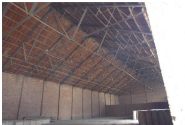
红砖仓库顶部的钢架人字梁

其次，作为一个经历过公私合营，从计划经济时代走到今天的老企业，除了厂房车间、仓储库房等生产设施外，大华纱厂还建设了职工住宅区并配备有中学、图书馆、幼儿园、食堂、医院、浴池、招待所、篮球场等生活福利设施。与众多计划经济时代的大型国企一样，工厂包揽着职工生活的方方面面。厂区一些职工家庭，两代人都在同一个工厂劳动、工作、谋生。因此，这个完整的工厂社区不仅是地图上、道路旁物化的实物，更赋予了厂区职工的价值归属感，成为众多西安老市民生活中的往事记忆。它是一个城市的符号，一段历史的承载。它的保留与保护，是对西安城市文化多元化的一种努力，是对西安市民文化记忆的一种尊重。