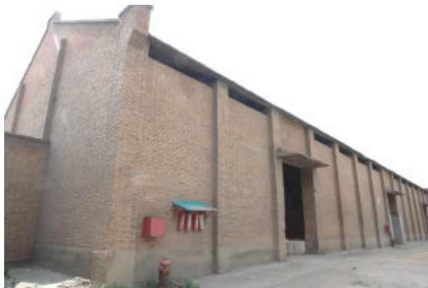
二十世纪七十年代建造的红砖仓库