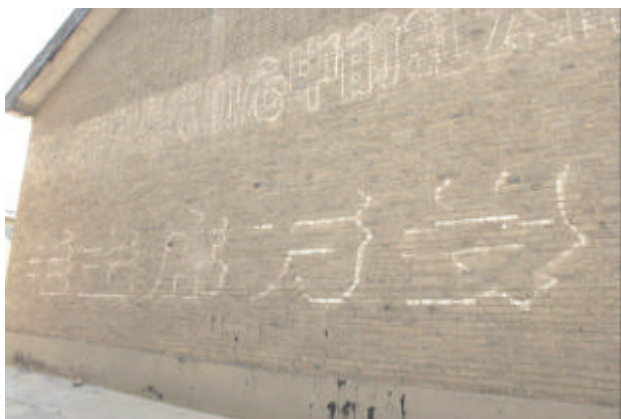
仓库墙上所刷标语痕迹