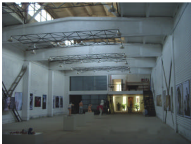
纺织城艺术区“创造工房”摄影及雕塑展厅