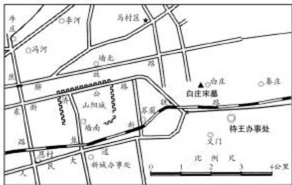
图1 白庄宋墓地理位置示意图