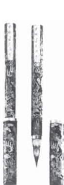
明嘉靖彩漆云龙管笔