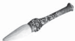
明万历青花缠枝龙纹瓷管羊毫笔