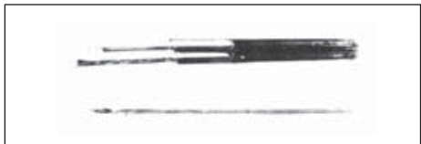
甘肃天水放马滩一号墓出土的秦代毛笔

战国时代是毛笔的发展期。战国时期帛画龙凤仕女图和人物驭龙图，画中线条有扁有圆，粗细变化自然，显然为毛笔所画。从文物出土分布地区看，到了战国时，毛笔在华夏区域已被广泛应用于书写文字和绘画。当时毛笔样式仍较原始，但制作