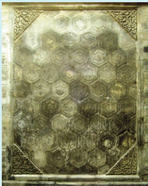
图一一 “龟背纹”影壁(砖雕)

蝙蝠体型不大,头尖身有翼,色灰暗,其貌不扬,常年躲在黑暗处,只有在夜间出来活动。中国古代建筑天花板上的架梁因为不见光亮,所以成了蝙蝠栖居之所,架梁上往往积聚许多蝙蝠粪便,成为古建筑的有害之物,但恰恰又是在这些建筑的木雕、砖石雕刻的装饰里常常见到蝙蝠的身影,这原因皆归功于它的名称与“偏福”谐音。因此建筑很多的地方都用蝙蝠纹样来装饰,格扇的窗格上,门板上,尤其是影壁上,总之,遍地是蝠(福)。王家大院凝瑞居门前的“五福捧寿”影壁即体现了一种讨吉利与祝福性质的意愿。五福(五蝠)指旧时所说的五种幸福“寿、富、康宁、攸好德、考终命”(图一〇)。