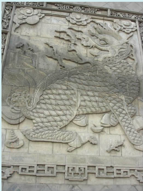
图三 七珍麒麟影壁(砖雕)

福、祝寿、升迁、镇宅避邪等愿望。无不深刻反映出宅主向往美好生活、趋吉避凶的生活态度,而且在众多的题材中,含蓄地寄寓着主人或企盼吉祥如意,或追求功名利禄,或希望安居乐业的美好意愿。