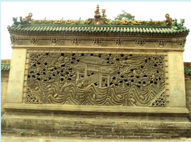
图六 “鲤鱼跃龙门”影壁(砖雕)