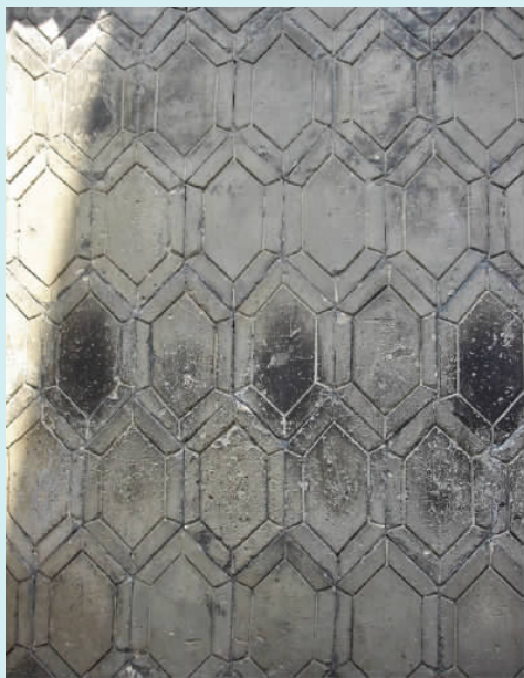
图一二 “龟背纹”影壁(砖雕)