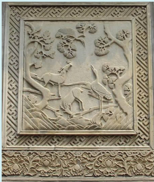
图八 鹿鹤同春影壁(石雕)

鹿,在装饰中与“禄”同音,表示吉祥福禄。鹤,寿命长,有的长达数十年,在鸟中罕见,所以古时将人之长寿称为鹤寿、鹤龄、龟鹤之年,也称“仙鹤”。鹿和鹤相遇,也便成了春天的象征,岁时的开始。记时的日历出现以后,鹿鹤一岁一度的换角、迁徙失去了记岁的意义,但又附会出仙兽仙鹤,象征帝位、高寿、爵位、俸禄、清廉等,再加上祝吉、祝寿、祝禄,使人们从民族民俗文化中又得到一种东方独有的艺术感受。王家大院鹿鹤同春影壁有四块,一块石雕,三块砖雕,题材虽然相同,但构图各异其趣,有古朴粗犷拙笨者,有纤巧细腻写实者,有变形扭曲丑陋者,但