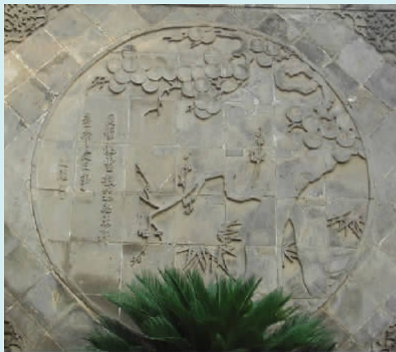
图一五 “岁寒三友”松竹梅影壁(砖雕)

龟,一种水生两栖动物,古人用龟甲和兽骨占卜吉凶,并将占卜结果刻于甲骨上,龟有寿命长,耐饥渴等特点,它很早就与龙凤虎合称为四神兽,它的形象自然也作为装饰用,龟背有六角形的纹,常用在墙壁上作为装饰纹样,称为龟背纹或龟甲纹,具有神圣与吉祥的象征意义,代表着长寿和财富。王家大院影