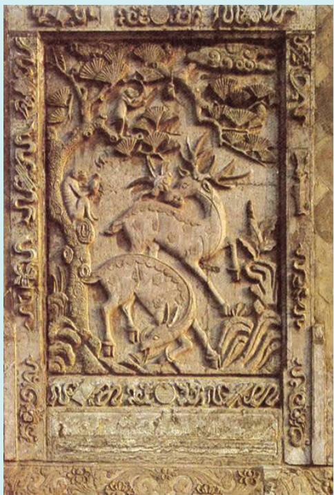
图九 封侯挂印影壁(石雕)

作为一种吉祥装饰建筑艺术构件,扭曲丑陋不失其幽默情趣,粗笨古朴中倒也有几分憨厚稚气存在,使人观后在不合理中求得合理,产生一种诙谐的愉悦感。