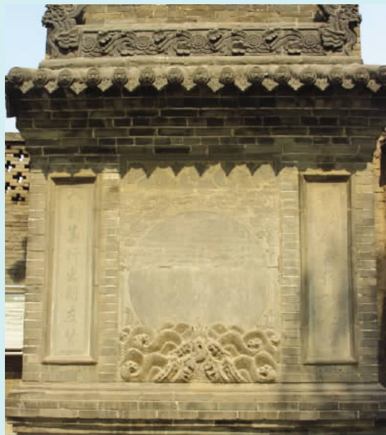
图一四 海水朝阳影壁(石雕)