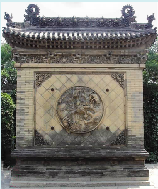
图二 敦厚宅门前整座影壁(砖雕)

巷影壁三种。独立影壁又分为一字、八字两种,其中一字型占大多数。坐山影壁不占地,仅在厢房山墙上做出檐和花饰,主要内容在壁心上,又称跨山影壁或者称三山式与五山式,王家大院大型坐山影壁有两幅,分别位于高家崖敦厚宅、凝瑞宅大门内。街巷影壁分为街巷顶头、侧门对面围墙之上两种。