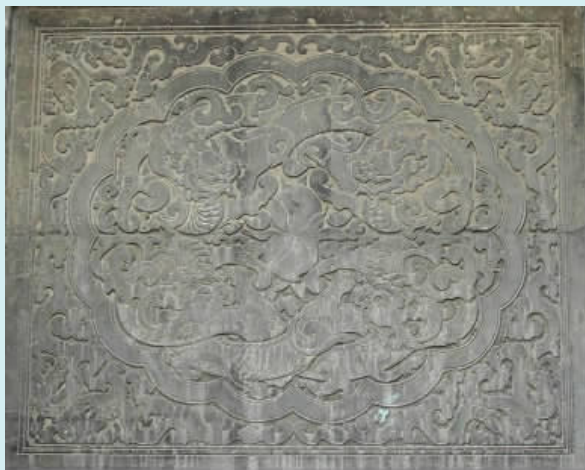
图四 四龙捧寿影壁(石雕)

“祥云瑞日麒麟图”是红门堡堡门外大型八字影壁主要构件之一,麒麟后坐回头注视祥云萦绕的太阳,身旁有天书、珊瑚、如意、方舟、法螺、灵芝、祥