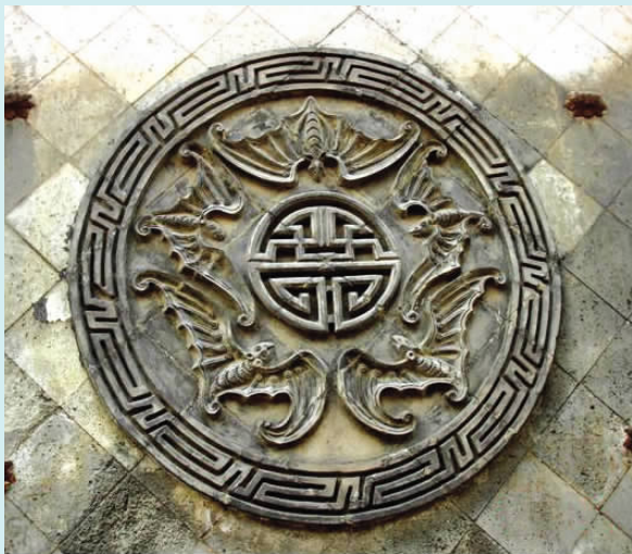
图一〇 五福捧寿(砖雕)

蝙蝠体型不大,头尖身有翼,色灰暗,其貌不扬,常年躲在黑暗处,只有在夜间出来活动。中国古代建筑天花板上的架梁因为不见光亮,所以成了蝙蝠栖居之所,架梁上往往积聚许多蝙蝠粪便,成为古建筑的有害之物,但恰恰又是在这些建筑的木雕、砖石雕刻的装饰里常常见到蝙蝠的身影,这原因皆归功于它的名称与“偏福”谐音。因此建筑很多的地方都用蝙蝠纹样来装饰,格扇的窗格上,门板上,尤其是影壁上,总之,遍地是蝠(福)。王家大院凝瑞居门前的“五福捧寿”影壁即体现了一种讨吉利与祝福性质的意愿。五福(五蝠)指旧时所说的五种幸福“寿、富、康宁、攸好德、考终命”(图一〇)。