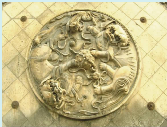
图五 “狮子滚绣球”影壁(砖雕)