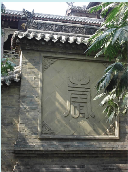
图一三 “寿”字影壁(砖雕)