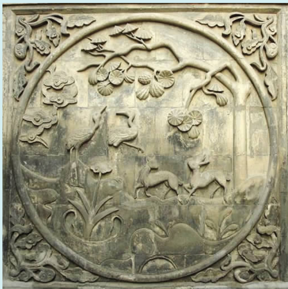
图七 鹿鹤同春影壁(砖雕)

云七珍,因此也叫“七珍麒麟图”。“祥云瑞日麒麟图”影壁中的七珍,“也是瑞兽给人们带来的瑞气,如法螺妙音吉祥,呼唤迷途之人;天书或称玉书,孔子精而读之;灵芝食之长生不老,能起死回生;祥云喻意官高爵显,青云得路,日月同辉。” [4] (图三)