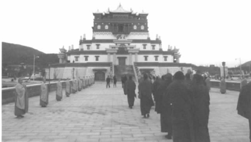
无锡灵山五印坛城

东侧,工程以灵山梵宫为核心,南向太湖,依次分布着梵宫广场、香水海、曼飞龙塔、五印坛城等佛教文化景观建筑。由石材等坚固耐久的材料为主材建造的灵山梵宫,以南北为轴线,东西呈对称分布,面宽150米,进深180米,总建筑面积达7万余平方米。梵宫依山势进退而建,层层推进。梵宫内部各建筑空间独立且互相贯通,从南往北,依次分布着门厅、廊厅、塔厅和圣坛。东西两侧则为佛教餐饮区和会议区。灵山梵宫建筑形式突破传统,大量运用高大的廊柱、大跨度的梁柱、高耸的穹顶、超大面积的厅堂等,内部装饰以精湛细腻的东阳