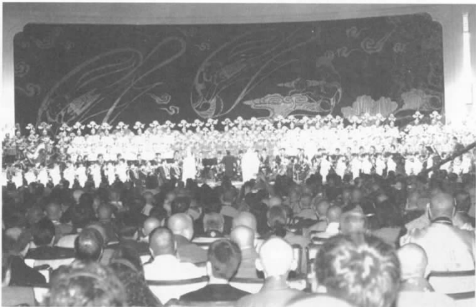
盛大的开幕演出《妙音颂吉祥》

3月29日下午5时许,论坛主办方还在梵宫圣坛上演了一场大型佛教音乐史诗古装情景剧《吉祥颂》。当大众就座后,全场灯光一时熄灭,四壁轰然转动,白色荧幕缓缓露出,《佛所行赞》经卷的影像也随之在荧幕上显示展开,演出开始。这部情景剧结合灵山梵宫先进的空间成像系统、变幻多端的灯光设备以及旋转移动的舞台,给现场观众带来了震撼的视听享受。在近一小时的演出时间里,在场的1000多名观众和近800名演员一起见证了这部作品的不凡气度。演出共分成大千世界、王宫内外、雨夜沉思、佛颂等八个单元,再现了两千五百多年前古印度迦毗罗卫国悉达多太子舍王位出家修道,最后于菩提树下觉悟成佛的历史故事。随着剧情的变化,全场时时响起热烈的掌声。吉祥生自觉悟,而觉悟缘自对生死、对苦乐的体察与反思。佛陀希冀为世人寻求解脱大道,而了悟只有深入内心世界,才能正见诸法之实相。《吉祥颂》中的这条觉悟之路走得无比的决绝和艰辛,却又走得无比的真诚与华丽。270度可开合旋转的立体舞台,数十米高