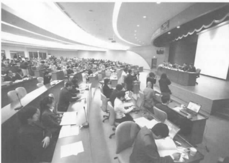
台北佛光大学分论坛

会承办;“佛教的慈善关怀”安排在慈济板桥园区,由慈济慈善事业基金会承办;“佛教的宗派融合”安排在台北佛光山金光明寺,由佛光山丛林学院承办;“佛教的组织管理”安排在佛光山台北道场,由台北南华大学承办;“佛教的弘法传播”也安排在佛光山台北道场,由佛光山电视弘法基金会承办;“佛教的国际交流”和“佛教与现代性”均安排在台北佛光大学,由佛光大学承办。这八个分论坛议题与承办单位的特点相结合,加上各承办方还组织与会者进行了参观,从而给中外嘉宾留下深刻印象。