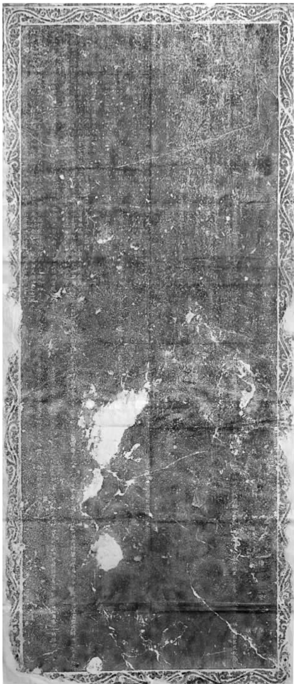
图二 神道碑照片(拓片)