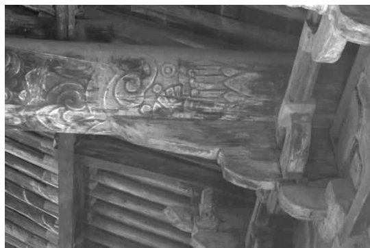
图一四 重阳殿内斗拱彩画