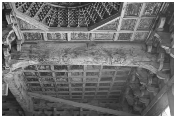
图七 纯阳殿内梁枋彩画