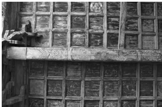
图八 纯阳殿内梁枋彩画

枋与丁枋上的旋花已减至一条,与其他的花纹混合而成,旋花在图案中的主要地位已经不存在了,总的来说,图案格局向着简略化的方向改进,彩画的画面效果看上去清淡雅致(图七、图八)。