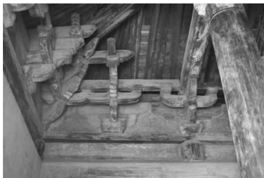
图一三 重阳殿内斗拱彩画

第三,彩画画法方面:三清殿彩画采用了“勾填法”,这是一种先用墨线勾绘出花纹轮廓,然后填染色彩的绘制方法。从画面的效果看,三清殿彩画中的花卉与龙身均以彩色烘托出阴阳向背,彩画中的