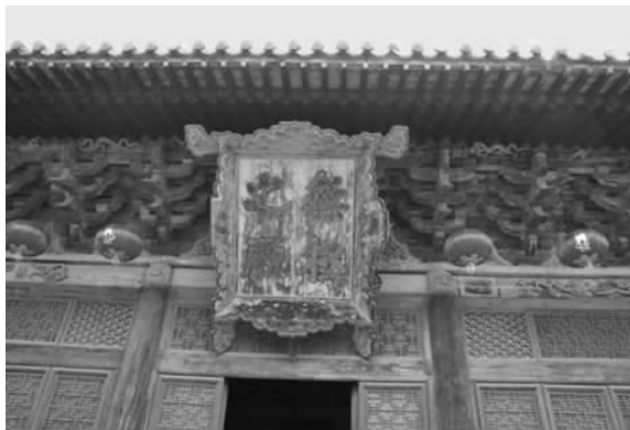
图一 三清殿外檐彩画

总体观察三清殿彩画,内檐彩画,不仅保存完整,而且绘制技术精美。内檐彩画中要数天花板下的各种梁枋上仰视面彩画最为精彩,这些梁枋上的彩画,丰富而又有序,规整而不凌乱。殿内所使用的