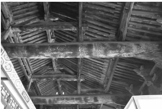
图一— 重阳殿内平梁及四椽枋彩画