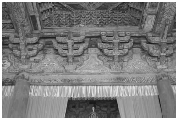
图四 三清殿内斗拱彩画

三清殿斗拱彩画犹如一幅艺术画卷,纹饰与色彩运用得恰到好处,斗拱彩画以旋花瓣为主,而如意头、荷花等纹饰穿插其间,变化灵活,看不到图案中有相同纹样出现。例如斗拱的栌斗上,不同的花纹