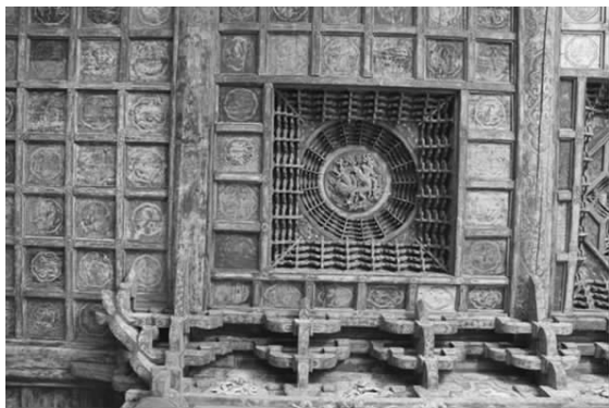
图五 三清殿内藻井彩画