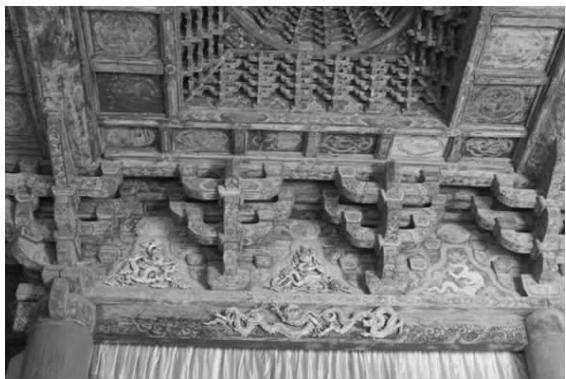
图三 三清殿内槽阑额及斗拱彩画

两根丁栿和六根四椽栿上的彩画极具观赏价值。在这些构件上绘制的花纹丰富多样,表现手法娴熟细腻,构件两端旋花,颜色均为青绿色锦,旋花组合多姿多彩,就是同一个构件上的旋花布置也不对称,从旋花的应用范围上看,已经成为当时彩画的基本纹饰题材。两端旋花的中间是枋心部分,这是绘制各种花纹的主要部位。三清殿每个构件的枋心尺寸是不一致的,枋心里面绘制的花纹既复杂也细腻,总体来说花纹组合自然,看不到有雷同的花纹出现(图二)。