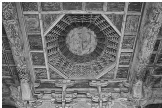
图六 纯阳殿内藻井、梁枋彩画

纯阳殿彩画色彩是青绿二色退晕,拱眼壁绘有写生花卉,并且施金,其他部位彩画没有金饰,彩画图案以纹样为主。纯阳殿彩画有一个特点就是在在一个构件中左右两端花纹对称,各个构件彩画轮廓也基本一致,旋花线条减缩,地位退化。例如殿内四椽