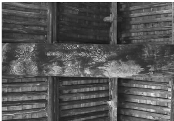
图一二 重阳殿内四椽枋底部彩画

光”十分相似,这是束莲向圭线光过渡的一种表现形式,从束莲占居四椽枋的比例看,是四椽枋总长度的七分之一。这种以束莲为题材,所表现的箍头形式是重阳殿彩画的又一个特点。这种形式的彩画仅绘制在殿内两根四椽枋上面,根据有关专家辨认四椽枋中间的宝相花纹样有重叠笔迹,看来该纹样是在原作基础上重新描过的(图一—、图一二)。