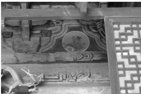
图一〇 纯阳殿内神龛中的拱眼壁彩画

边缘,黑色的底衬,金色的龙纹,有机地组合为一体,图案中各种纹样勾绘得比较细腻逼真,金龙游荡在花卉之间,龙头宽阔,龙鳞尽现,从龙的形态观察,是清代在原有基础上进行补绘而成的。