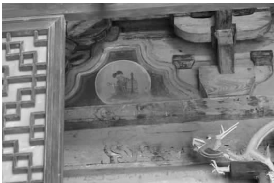
图九 纯阳殿内神龛中的拱眼壁彩画