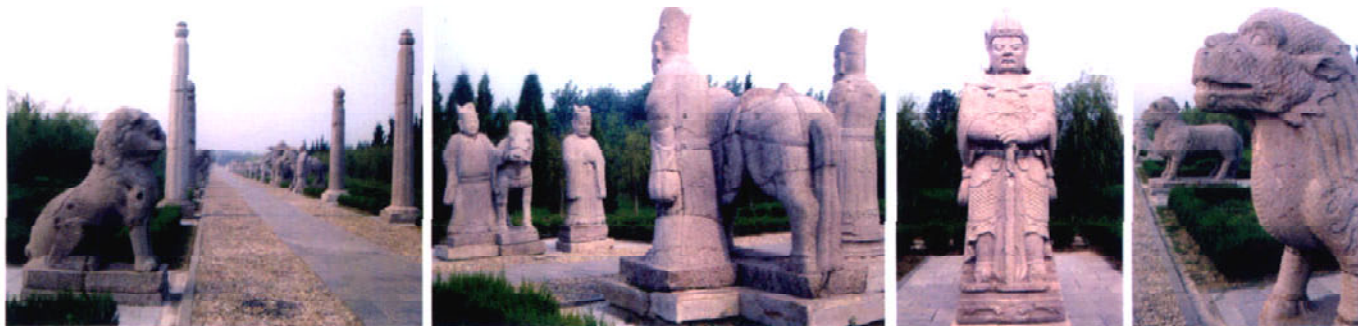
明皇陵位于安徽凤阳

乏创造性和生命力。手法写实寓巧于拙，线条流畅，细微处精雕细琢，融整体宏大与局部精细为一体，它们代表着明初时期石雕艺术最高水平。其形体高大、粗壮、厚重、简朴，但却缺少气势。很显然，明代陵墓石雕艺术特点有追汉、唐风格痕迹。其面貌大多缺乏新意，从题材到雕刻手法日趋世俗化，民间化。这些都普遍反映着传统悠久的装饰趣味，使明代汉族文化得到复兴，传统工艺与雕塑艺术得到发扬。