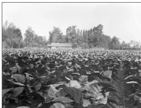
英国自然学家威尔逊 1908 年在四川拍摄的烟草种植照片

许多烟民都有这种感受：吸烟可以排忧解难，消除紧张，填补空虚，放松身心。精神痛苦、情绪激动、工作紧张、寂寞无