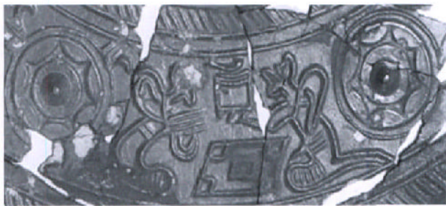
图四 仙人博弈图细部