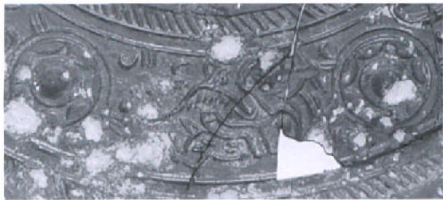
图三 羽人骑鹿图细部