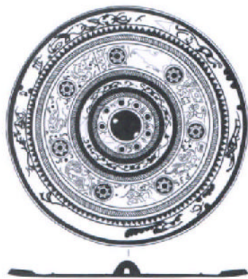
图二 四神仙人镜平剖面图