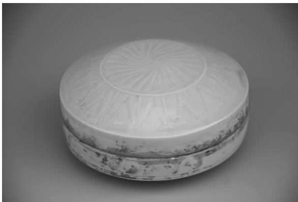
图一 北宋白釉刻花菊瓣纹盒

所饰菊瓣纹图案与宋代磁州窑白釉剔花牡丹纹瓶肩部 [4] 、宋代耀州窑青釉刻团花纹菊瓣碗 [5] 、宋代耀州窑印花撇口大碗碗心 [6] 、宋代临汝窑印花碗碗心 [7] 、宋代定窑白釉盖罐的盖面及罐体肩部 [8] 的菊瓣纹相类似。蕉叶纹是定窑常用的纹饰题材,此盒盖沿刻饰的蕉叶纹与北宋定窑刻花花瓣纹盖罐 [9] 、龙泉窑刻花牡丹纹瓶盖面 [10] 等器物上的蕉叶纹相近。综合以上几例器物的造型与纹饰,说明宋代大量地使用菊瓣、蕉叶纹饰和扁圆形的造型,据此我们可以推断这件白釉瓷盒的烧造年代应在北宋时期。另外我们还可以根据这件白釉盒的工艺特点判定其窑口,经仔细观察,我们发现这件白釉盒有如下工艺特征:1.胎薄而轻,胎色洁白,胎质坚致细腻。2.白釉微微泛黄,呈乳白色,似象牙白,聚釉处隐现出黄绿色。3.刻花