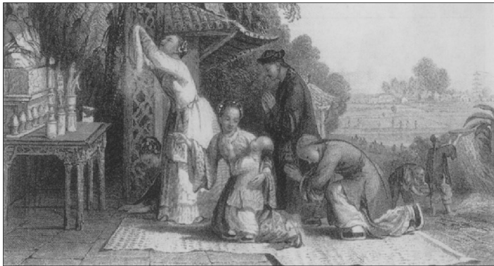
拜祖上香是中国人自古延续下来的传统