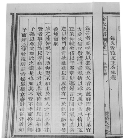
《祁门）京北金氏宗谱》（1931年）中的家法

6. 务正义。我祖宗忠孝传家，无犯法男子，无再醮妇人。在后世子孙，必务正业，只有士农工商四条路。至于地理医道，虽非邪术，恐学之不精，误人不少，切不可图其事之安逸，而